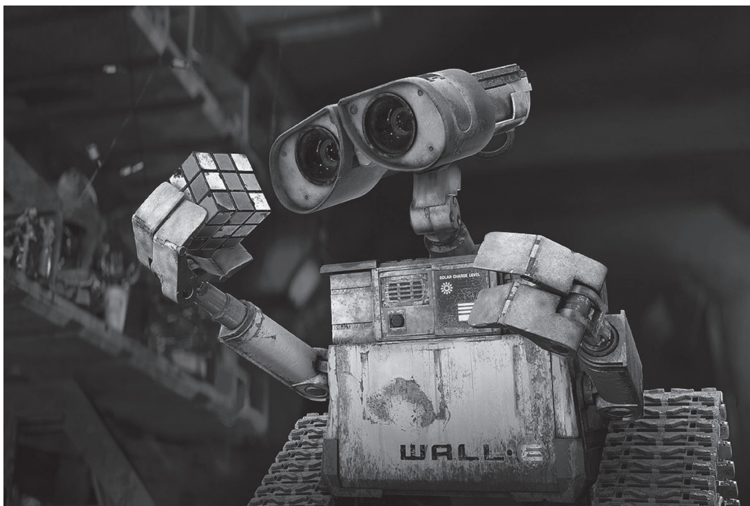
Figura 2 – Pixar, Wall-E , 2008, in https://vignette.wikia.nocookie.net/pixar/images/c/ce/Wall-E_Cubecolors.jpg/revision/latest?cb=20090615011459 (consultado em dezembro de 2017)