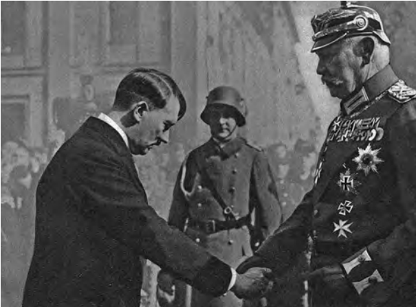
A – Nomeação de Adolf Hitler como chanceler da Alemanha pelo respetivo presidente.