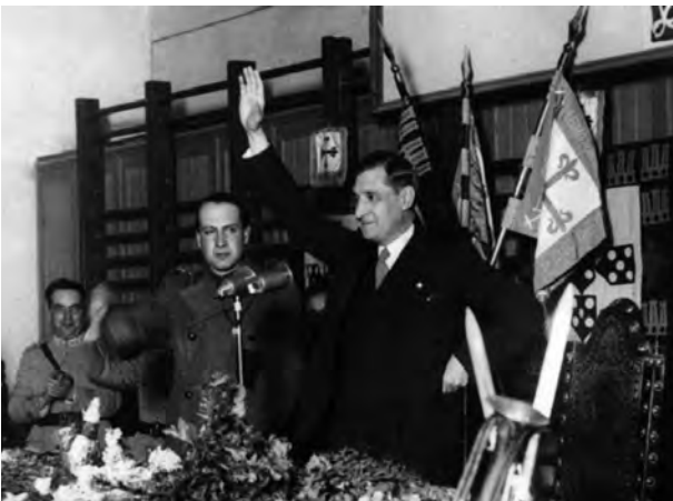
C – Nomeação de António de Oliveira Salazar para ministro das Finanças.