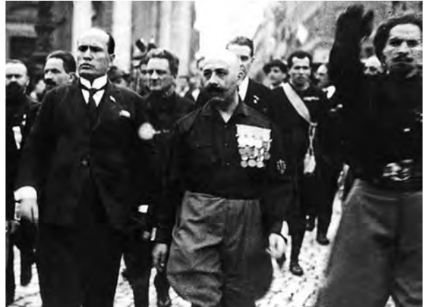
B – Benito Mussolini na manifestação conhecida como Marcha sobre Roma.