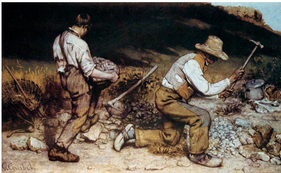
Figura 7 – Gustave Courbet, Os Britadores de Pedra , 1849, óleo sobre tela, in www.wga.hu/art/c/courbet/1/coub103.jpg (consultado em novembro de 2013)

José Júlio Andrade dos Santos, «Pintura realista», in Dicionário da Pintura Universal , vol. II, Lisboa, Editorial Estúdios Cor, 1965, pp. 188-189 (adaptado)