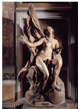
Gian Lorenzo Bernini, Verdade , 1645-1652, in www.wga.hu/art/b/bernini/gianlore/sculptur/1640/justice.jpg