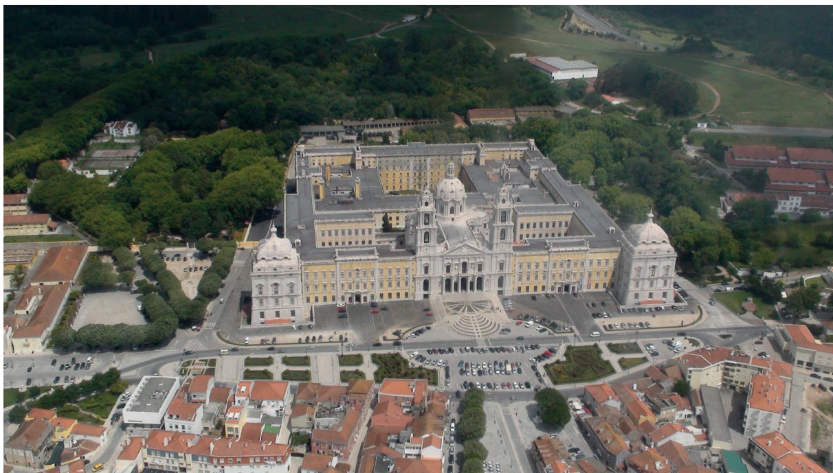
Figura 6 – Real Edifício de Mafra, 1717-1730, vista aérea

2. A Figura 6 e o Texto A remetem para o Real Edifício de Mafra .