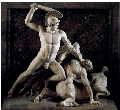
Antonio Canova, Teseu e o Centauro , 1804-1819, in www.wga.hu/art/c/canova/2/6theseu.jpg

3. O conjunto documental seguinte apresenta obras escultóricas de diferentes estilos ou períodos artísticos.