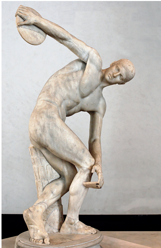
Figura 1 – Discóbolo , cópia romana do original grego de Míron, c. 450 a. C., in http://it.wikipedia.org/wiki/File:Discobolus_Lancelotti_Massimo.jpg (consultado em novembro de 2013)

1. A Figura 1 apresenta a escultura de um atleta grego.