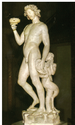
Miguel Ângelo, Baco, 1496-1497

Associe cada obra referida na coluna A a um dos estilos ou períodos artísticos referidos na coluna B , atendendo às imagens do conjunto documental.