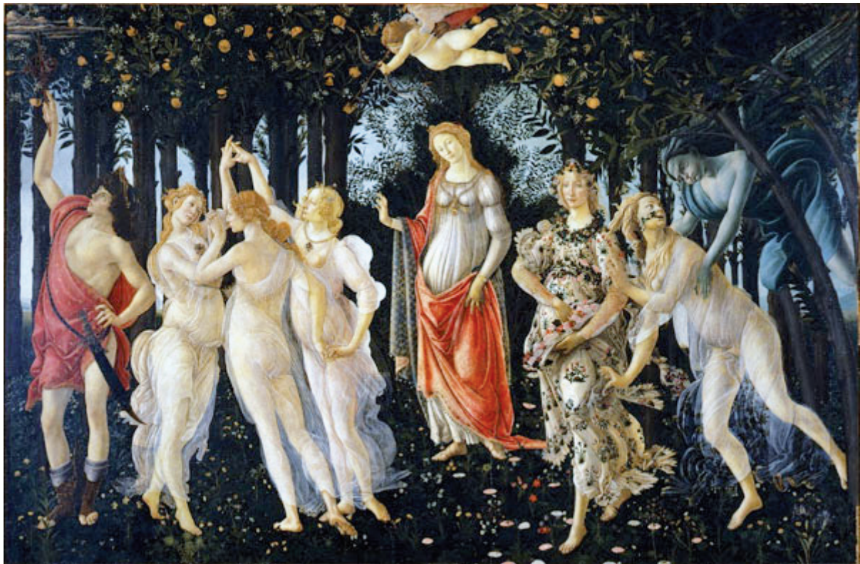
Figura 5 – Sandro Botticelli, A Primavera , 1477-1482, têmpera sobre madeira, in www.uffizi.org/artworks/la-primavera-allegory-of-spring-by-sandro-botticelli/ (consultado em novembro de 2013)

1. A Figura 5 apresenta uma pintura renascentista.