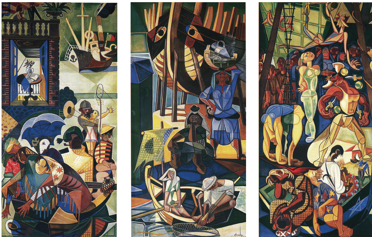
Figura 9 – Almada Negreiros, Tríptico da Gare Marítima da Rocha do Conde d'Óbidos , Lisboa, 1946-1948, in Almada, Gares Marítimas Alcântara e Rocha do Conde d'Óbidos , Lisboa, Administração do Porto de Lisboa, 2008, pp. 44-46

3. A Figura 9 e o Texto D remetem para a pintura modernista de Almada Negreiros.