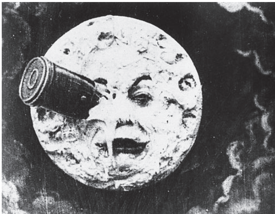
Figura 8 – Fotograma do filme Viagem à Lua , de Georges Méliès, 1902

2. A Figura 8 e o Texto C ilustram a importância do cinema no início do século XX.