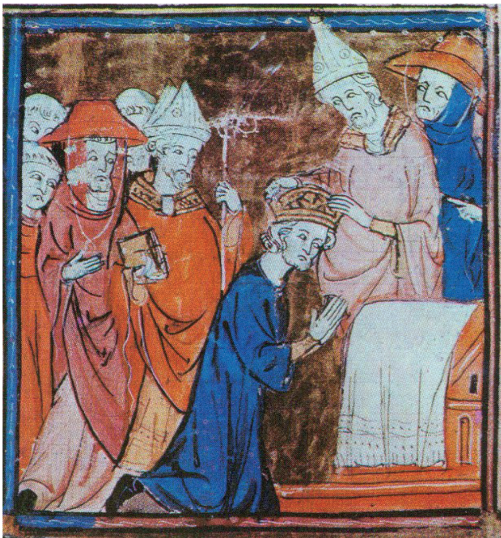
Figura 2 – A coroação de Carlos Magno no Natal de 800, em Roma, iluminura, c.1375-1379, in http://historymadeeveryday.files.wordpress.com/2013/10/charlemagne-crowned.jpg (consultado em novembro de 2013)

2. A Figura 2 representa a coroação de Carlos Magno.