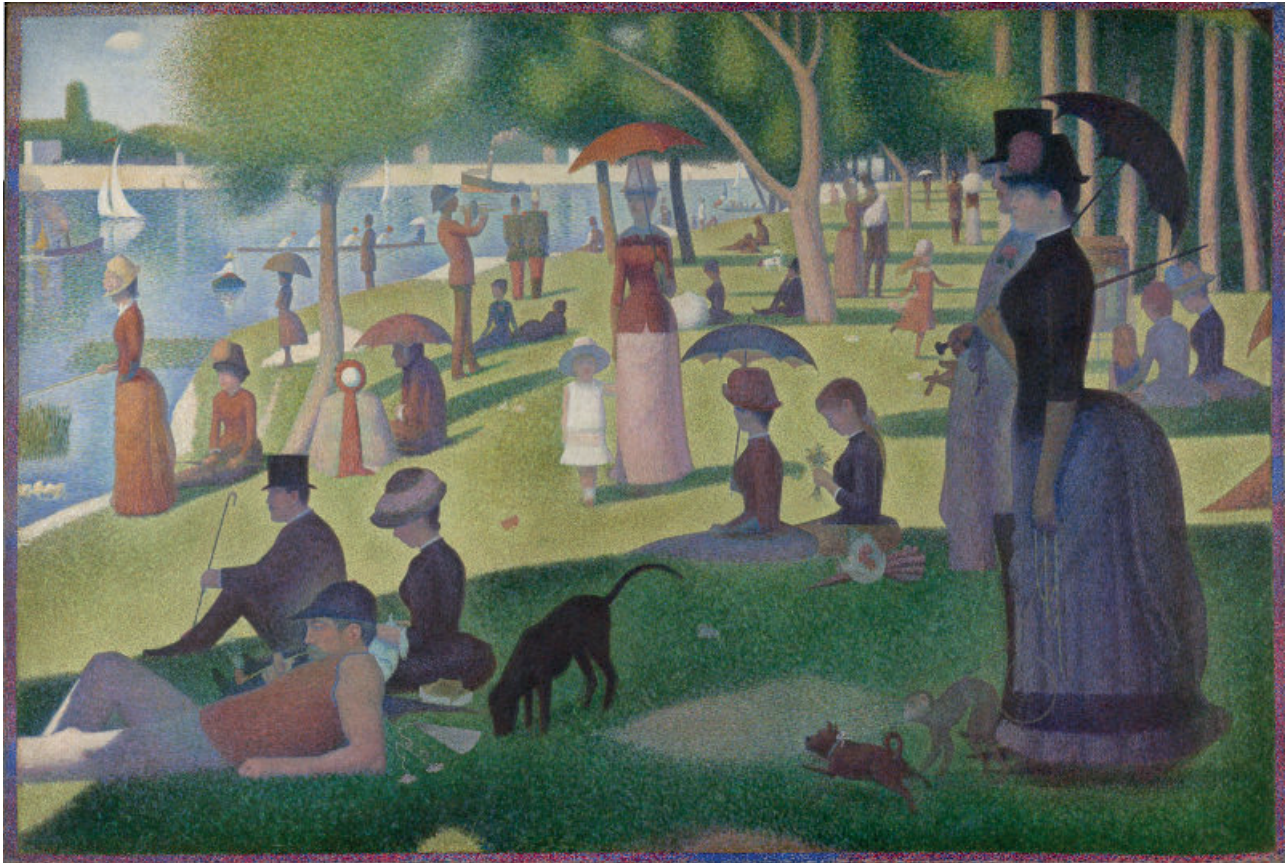
Figura 6 – Georges Seurat, Um Domingo à Tarde na Ilha da Grande Jatte , óleo sobre tela, 206 × 306 cm, 1884-1886, in www.artic.edu/aic/collections (consultado em novembro de 2014)

Refira quatro inovações da pintura neoimpressionista de Georges Seurat, evidenciadas na Figura 6.