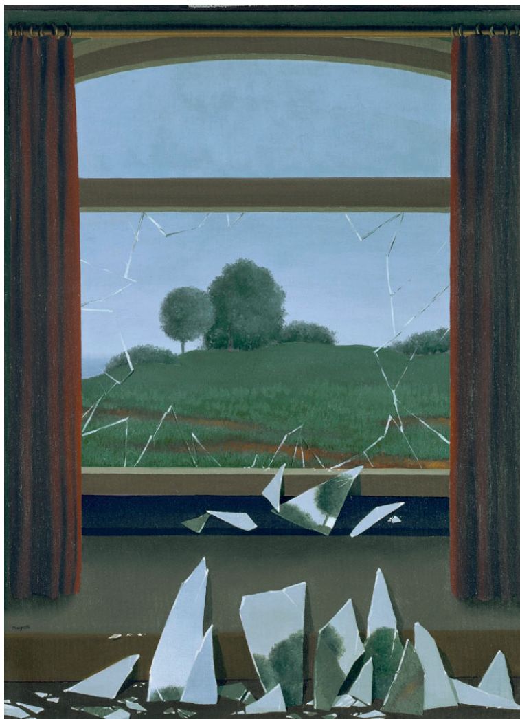
Figura 7 – René Magritte, A Chave dos Campos , 1936, in www.museothyssen.org (consultado em novembro de 2014)