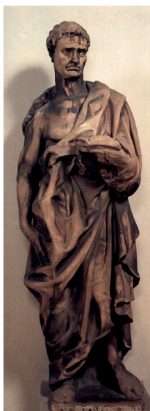
Donato Donatello, Profeta Jeremias, 1423-1426