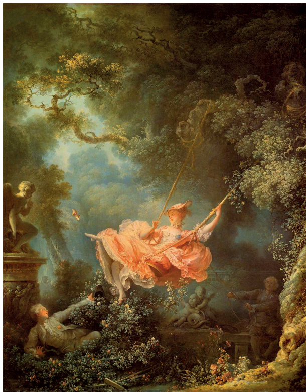
Figura 4 – Jean-Honoré Fragonard, O Baloço , 1767, in www.wga.hu (consultado em outubro de 2014)