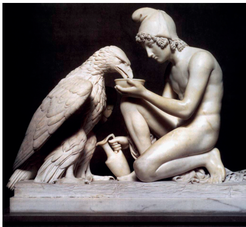
Bertel Thorvaldsen, Ganimesdes Dando de Beber a Zeus , 1817, in www.wga.hu