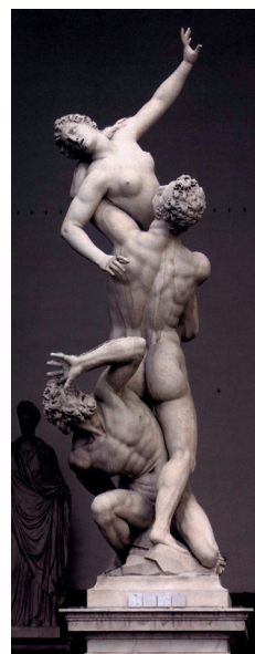
Giambologna, O Rapto das Sabinas , c. 1583

Associe cada obra referida na coluna A a um dos estilos ou períodos artísticos referidos na coluna B , atendendo às imagens do conjunto documental.