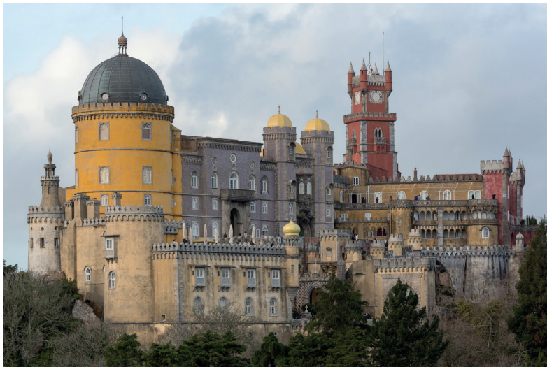
Figura 5 – D. Fernando II e barão von Eschwege, Palácio da Pena , 1838-1868/1885, in http://upload.wikimedia.org (consultado em outubro de 2014)

1. Observe a Figura 5 e leia os Textos D e E.