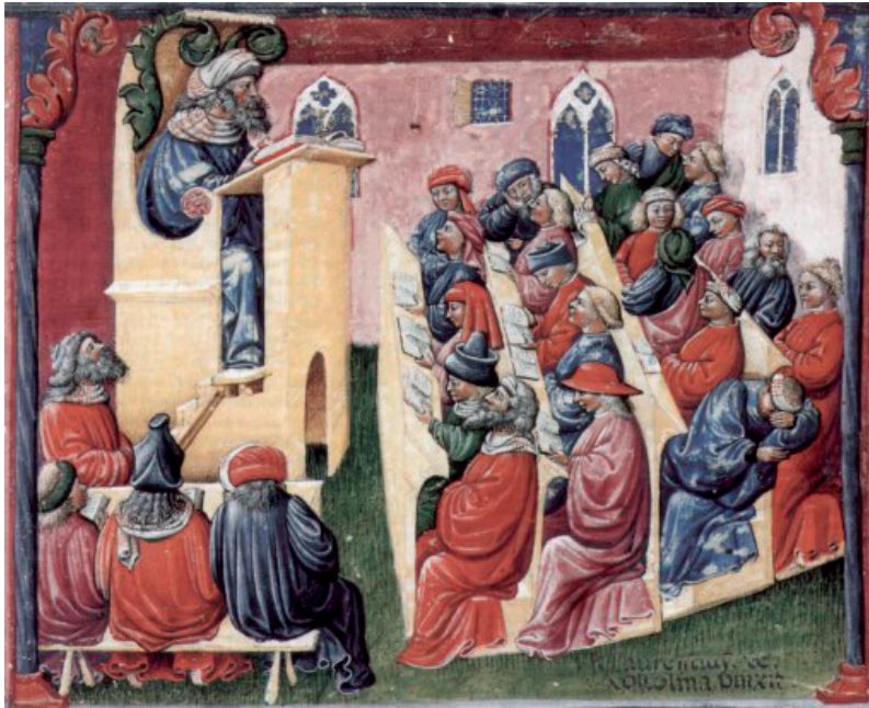
Figura 1 – Laurentius de Voltolina, iluminura de uma aula medieval, século XIV