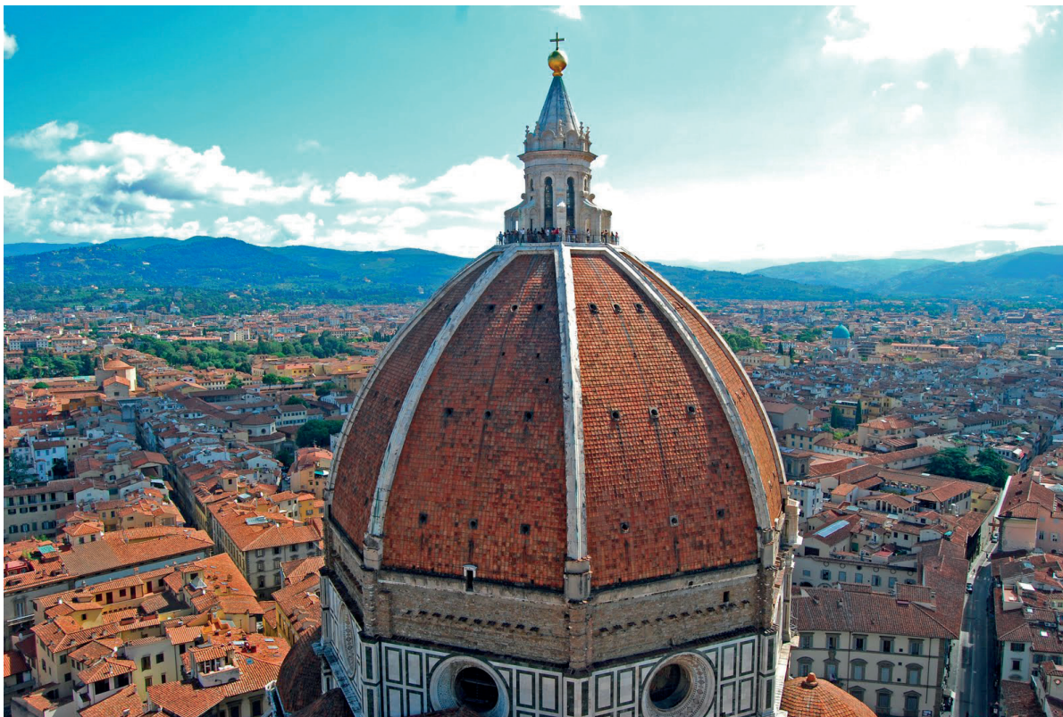
Figura 3 – Filippo Brunelleschi, cúpula da Catedral de Santa Maria das Flores , Florença, 1420-1436, in www.notasdeprensa.es (consultado em outubro de 2014)

1.1. Explícite quatro características da arquitetura renascentista, recorrendo à Figura 3.