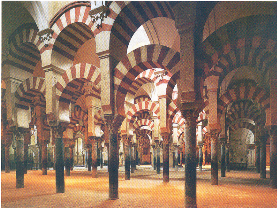
Figura 4 – Mesquita de Córdoba , vista interior da sala de oração, 785-987, in Penelope J. E. Davies et al., A Nova História da Arte de Janson , Lisboa, Fundação Calouste Gulbenkian, 2010

Explicite quatro das características da arquitetura religiosa islâmica dos séculos VIII a XII, recorrendo à observação da Figura 4.