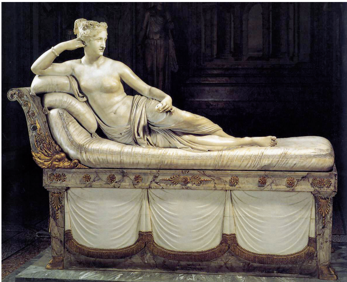
Figura 6 – Antonio Canova, Paolina Borghese como Venus Victrix , c. 1804-1808, mármore branco, in www.wga.hu (consultado em janeiro de 2011)