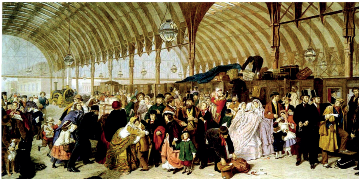
Figura 7 – William Powell Frith, Gare , 1862, óleo sobre tela, in www.victorianweb.org (consultado em janeiro de 2011)

Explícite quatro das características da gare do século XIX, recorrendo à observação da Figura 7.