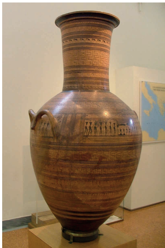
Figura 2 – Ânfora funerária ática do pintor de Dypilon, c. 760-750 a. C., in http://wikimedia.org (consultado em janeiro de 2011)