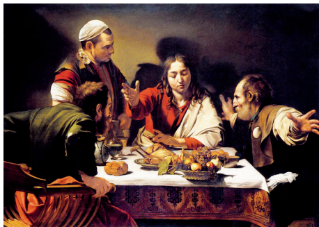
Caravaggio, Ceia em Emaús , 1601, óleo sobre tela, in www.wga.hu

2. Observe o conjunto documental seguinte.