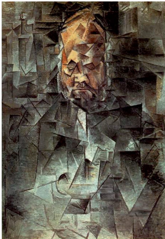
Figura 9 – Pablo Picasso, Retrato de Ambroise Vollard , 1910, in http://artistoria.files.wordpress.com (consultado em janeiro de 2011)