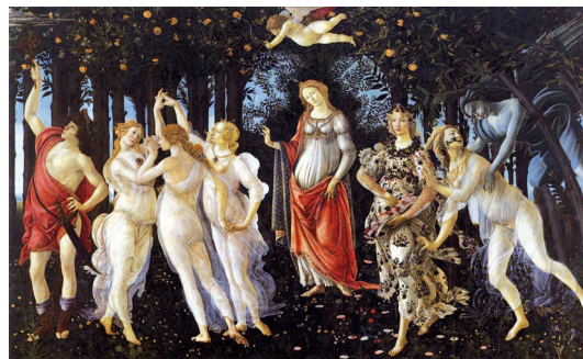
Botticelli, A Primavera , c. 1482, têmpera sobre madeira, in www.wga.hu