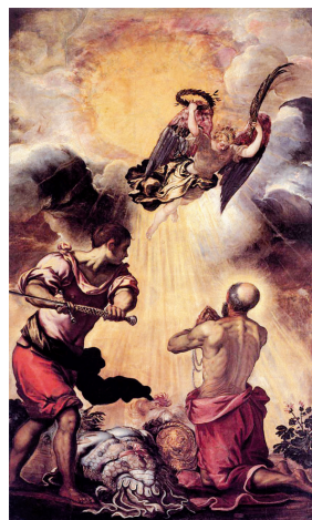
Tintoretto, O Martírio de S. Paulo , c. 1556, óleo sobre tela

2.1. Identifique, no conjunto documental, a obra cujos tema e representação se baseiam na mitologia grega.