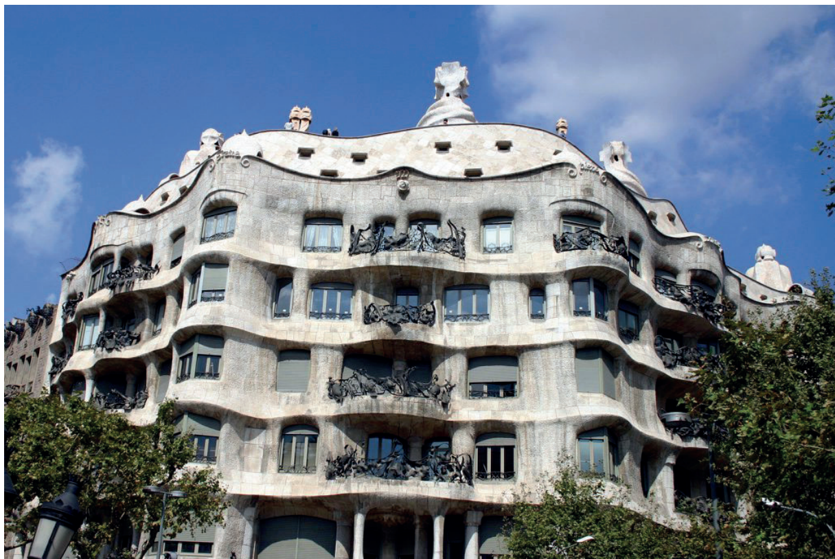
Figura 8 – Antoni Gaudí, Casa Milà , c. 1905-1912, Barcelona, Espanha, in www.marvelbuilding.com (consultado em novembro de 2012)

Explicite quatro dos aspetos da arquitetura de Antoni Gaudí, recorrendo à observação da Figura 8.