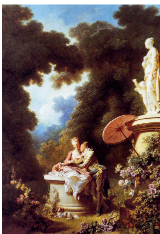
Fragonard, A Confissão do Amor , 1771, óleo sobre tela, in www.wga.hu