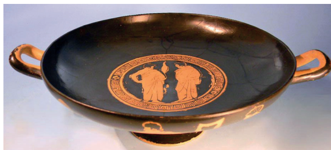
Figura 3 – Kylix de figuras vermelhas, cerâmica ática, c. 440-430 a. C., in www.hixenbaugh.net (consultado em dezembro de 2012)

Refira quatro das funções da cerâmica na civilização grega, recorrendo à observação das Figuras 2 e 3.