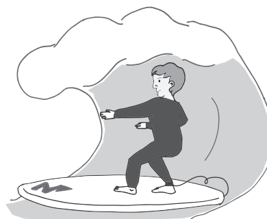
Surfista sobre a sua prancha