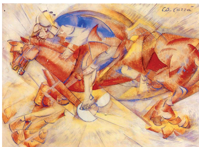
Figura 4 – O Cavaleiro Vermelho , 1913, Carlo Carrà