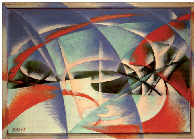
Figura 3 – Velocidade e Paisagem , 1913, Giacomo Balla