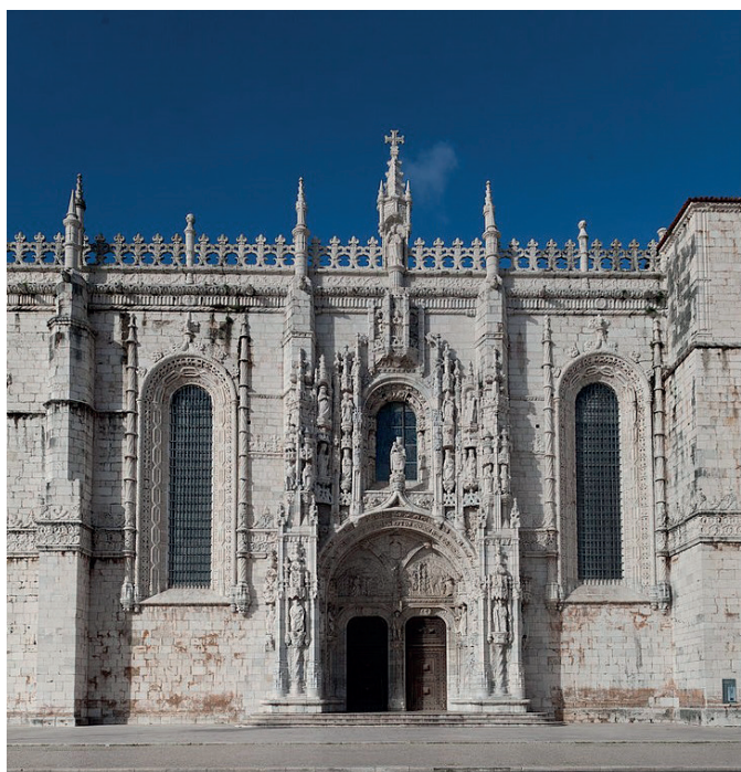
Figura 4 – João de Castilho, Portal sul da Igreja de Santa Maria de Belém, Mosteiro dos Jerónimos, c. 1517

Figura 3 in www.bluffton.edu (consultado em janeiro de 2016) Figura 4 in https://pt.wikipedia.org (consultado em janeiro de 2016)