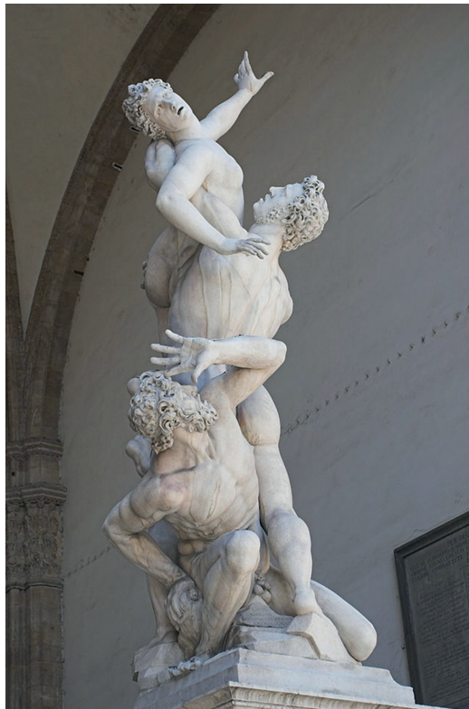
Figura 1 – Giambologna, O Rapto das Sabinas, 1583