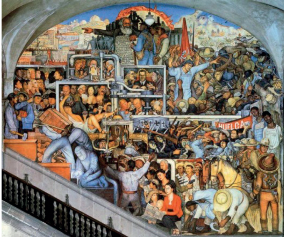
Figura 3 – Diego Rivera, A História do México: o mundo de hoje e de amanhã , fresco no Palácio Nacional do México, 1935