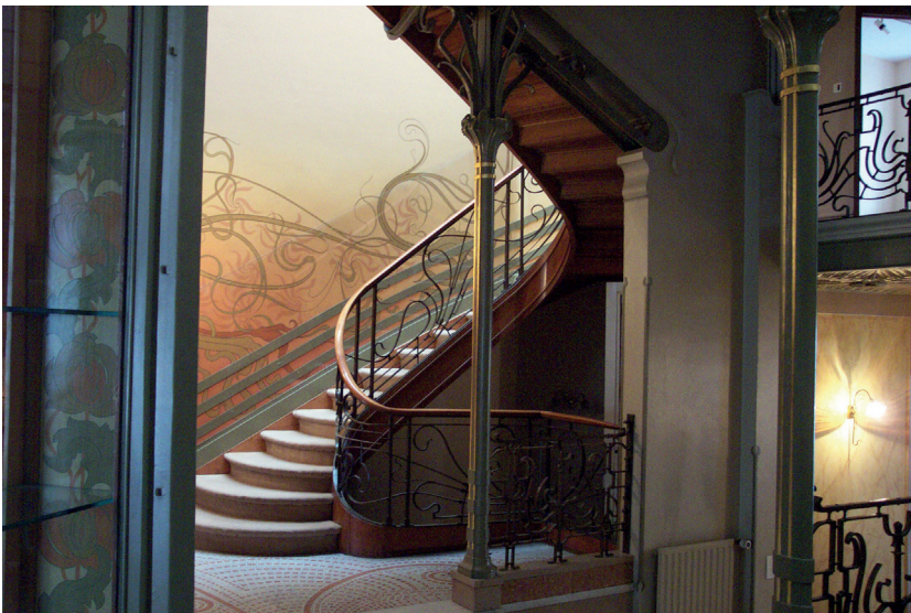
Figura 1 – Victor Horta, Escadaria da Casa Tassel , Bruxelas, Bélgica, 1893-1894