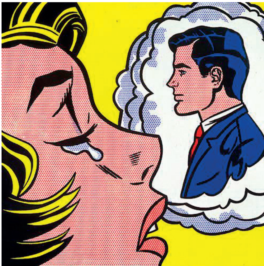
Figura 4 – Roy Lichtenstein, Thinking of him , 1963, óleo e verniz magna sobre tela, 172,7 cm × 172,7 cm