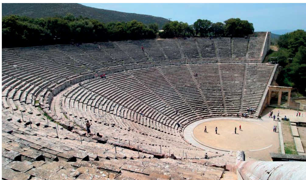
Figura 1 – Ruínas do Teatro de Dioniso , Atenas, séc. V a.C.

Ésquilo, Os Persas , Lisboa, Edições 70, 2014, p. 199