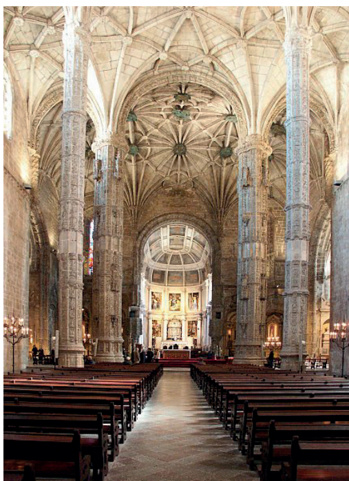
Figura 3 – João de Castilho, Interior da Igreja de Santa Maria de Belém, Mosteiro dos Jerónimos, c. 1517