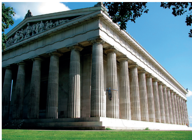
Franz Leo von Klenze, Templo de Walhalla, Ratisbona, 1816-1842

Associe cada obra referida na coluna A a um dos estilos ou períodos artísticos referidos na coluna B , atendendo às imagens do conjunto documental.