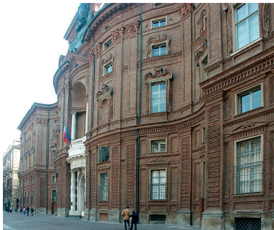
Guarino Guarini, Palácio Carignano, Turim, 1679-1684

3. Observe o conjunto documental seguinte.