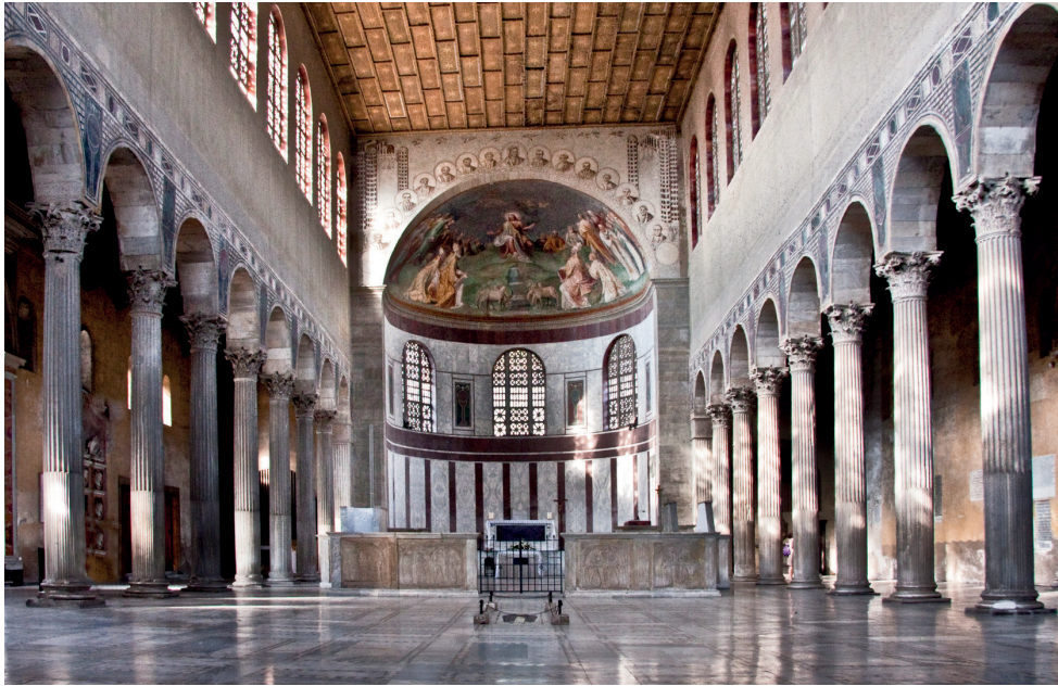
Figura 2 – Interior da Igreja de Santa Sabina, Roma, século V