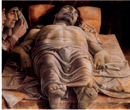
Figura 3 – Mantegna, Lamentação sobre Cristo Morto , 1475-1478, têmpera sobre tela, 68 cm × 81 cm