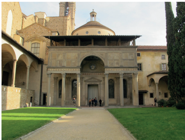
Filippo Brunelleschi, Capela Pazzi, Florença, c.1440-1460