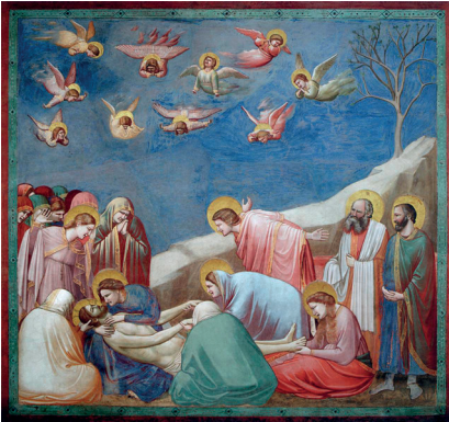
Figura 2 – Giotto, Lamentação sobre Cristo Morto , 1303-1305, fresco, 200 cm × 185 cm