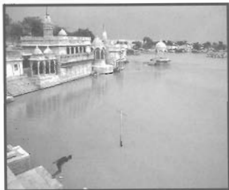
Imagen 3 – Jaisalmer (India)