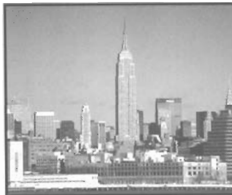
Imagen 4 – Nueva York (EE.UU.)