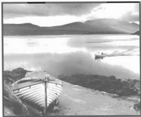
Imagen 1 – Escocia (Reino Unido)

Imagen 1 – Ven a Escocia. Olvidate del tiempo