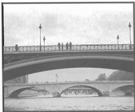
Imagen 5 – París (Francia)