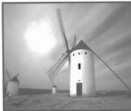
Imagen 2 – La Mancha (España)