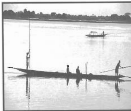
Imagen 6 – Segou (Mali)