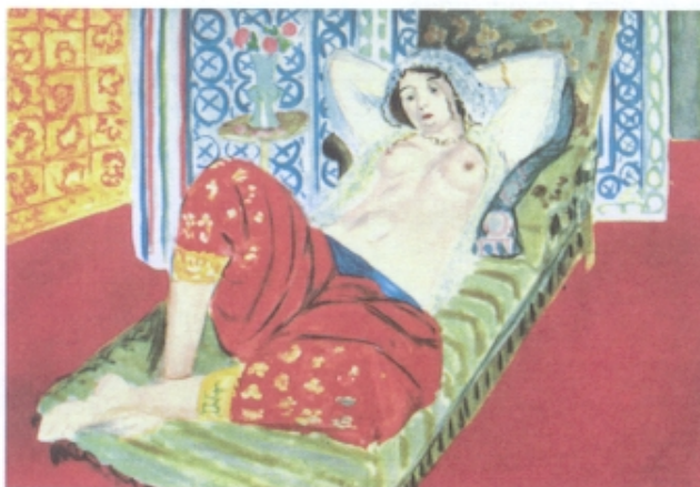
Fig. 2 – Henri Matisse, Odalisca com Calças Vermelhas (1921)