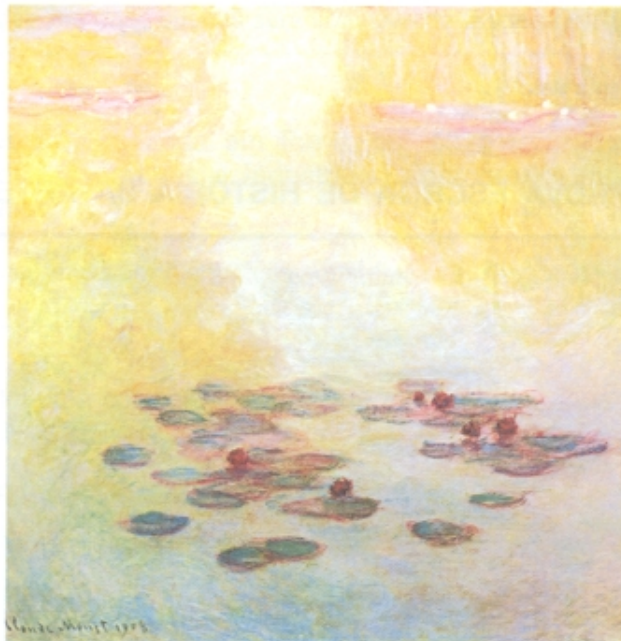
Fig. 1 – Claude Monet, Nenúfares (1908)