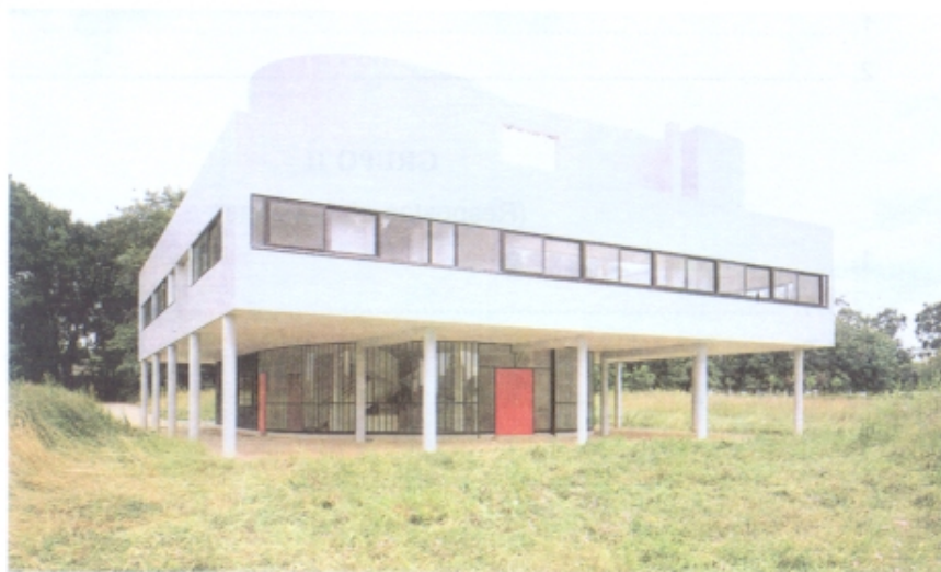
Fig. 4 – Le Corbusier e Pierre Jeanneret, Casa Savoy em Poissy (1929-1931)