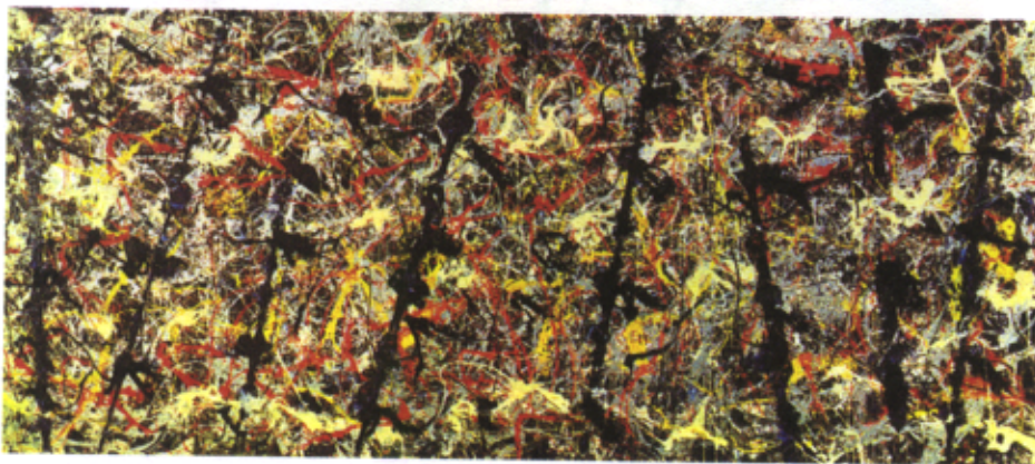
Figura 3 – Jackson Pollock, Blue Poles (1953)