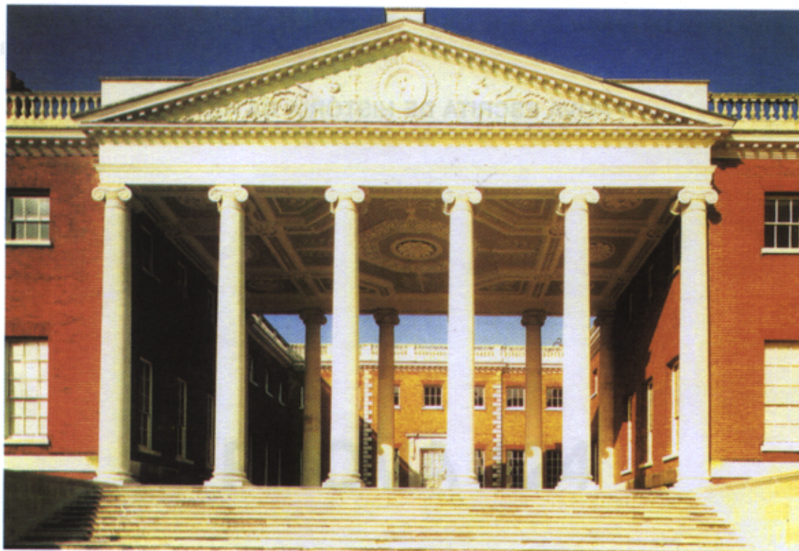
Figura 1 – Robert Adam, pórtico com frontão triangular na residência de Osterley Park, em Middlesex (1760, aprox.)