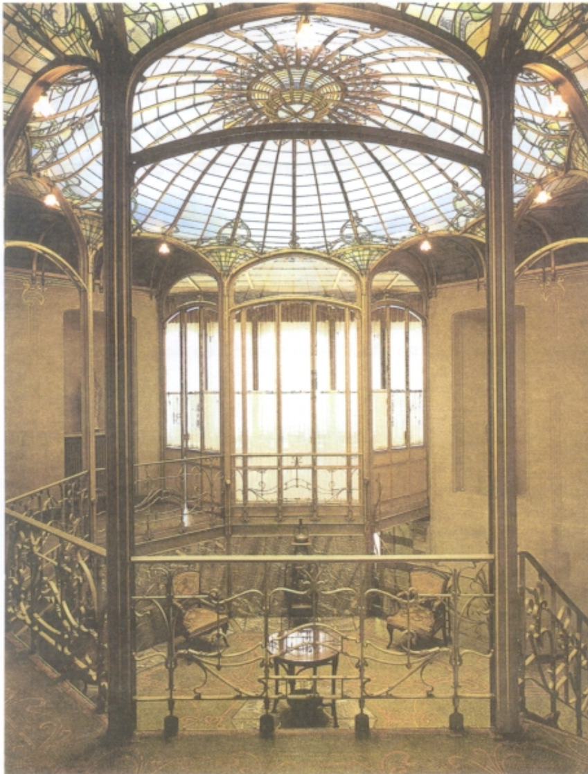
Fig. 1 – Victor Horta, Casa Van Eetvelde , em Bruxelas (1897-1900)