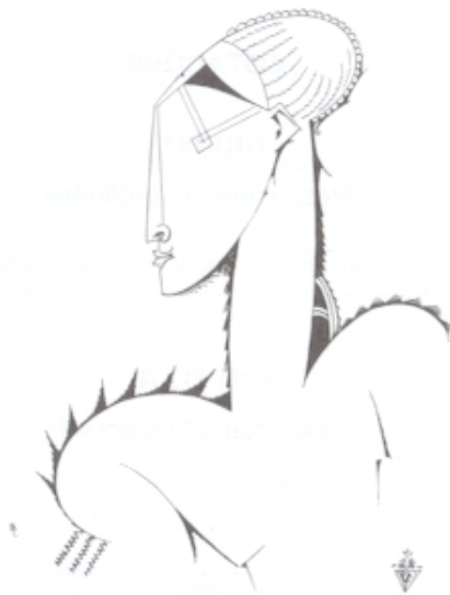
Fig. 3 – Amadeo de Souza- -Cardoso, desenho do álbum XX Dessins (1912)

Partindo da observação da figura acima, caracterize o Neoplasticismo.