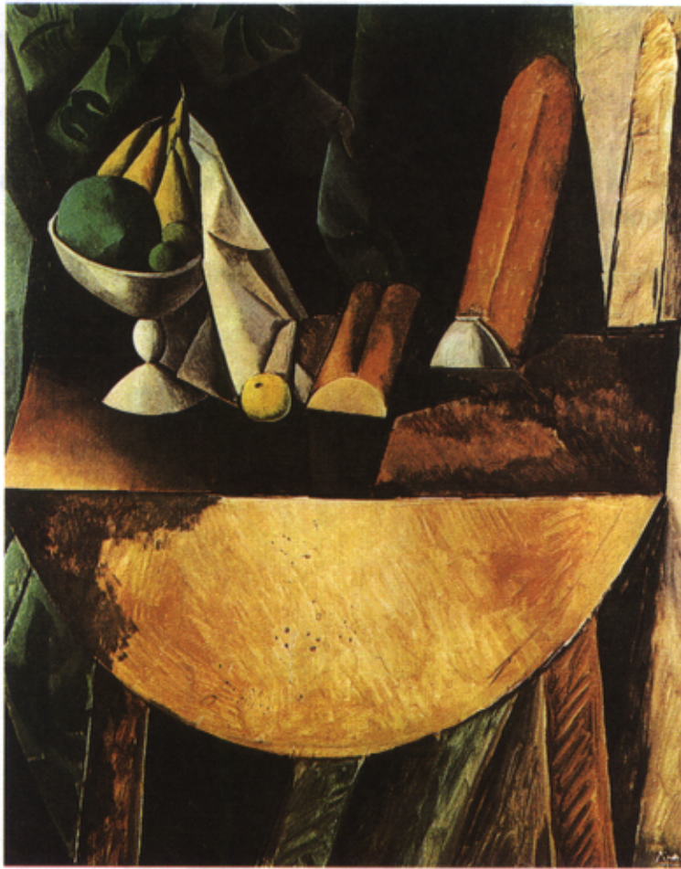
Figura 2 – Pablo Picasso, Pães e Taça com Frutos sobre uma Mesa (1909)