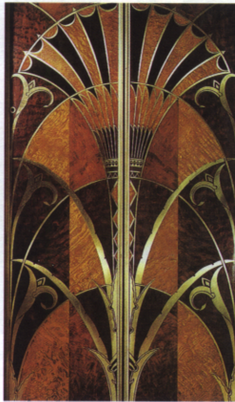
Figura 3 – Porta do elevador do Edifício Chrysler em Nova Iorque (1930)

Em 1925 a realização da Exposição Internacional de Artes Decorativas afirmaria o relevo dessas mesmas artes, num processo que se iniciara já no século XIX, com o Movimento Arts and Crafts .