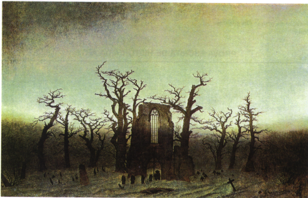
Figura 1 – Caspar David Friedrich, Abadia no Bosque de Castanheiros (1809-1810)