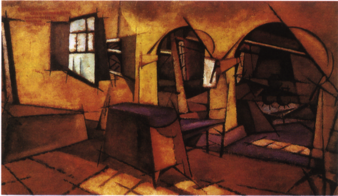
Figura 4 – Amadeo de Souza-Cardoso, Cozinha de Manhufe (1913)