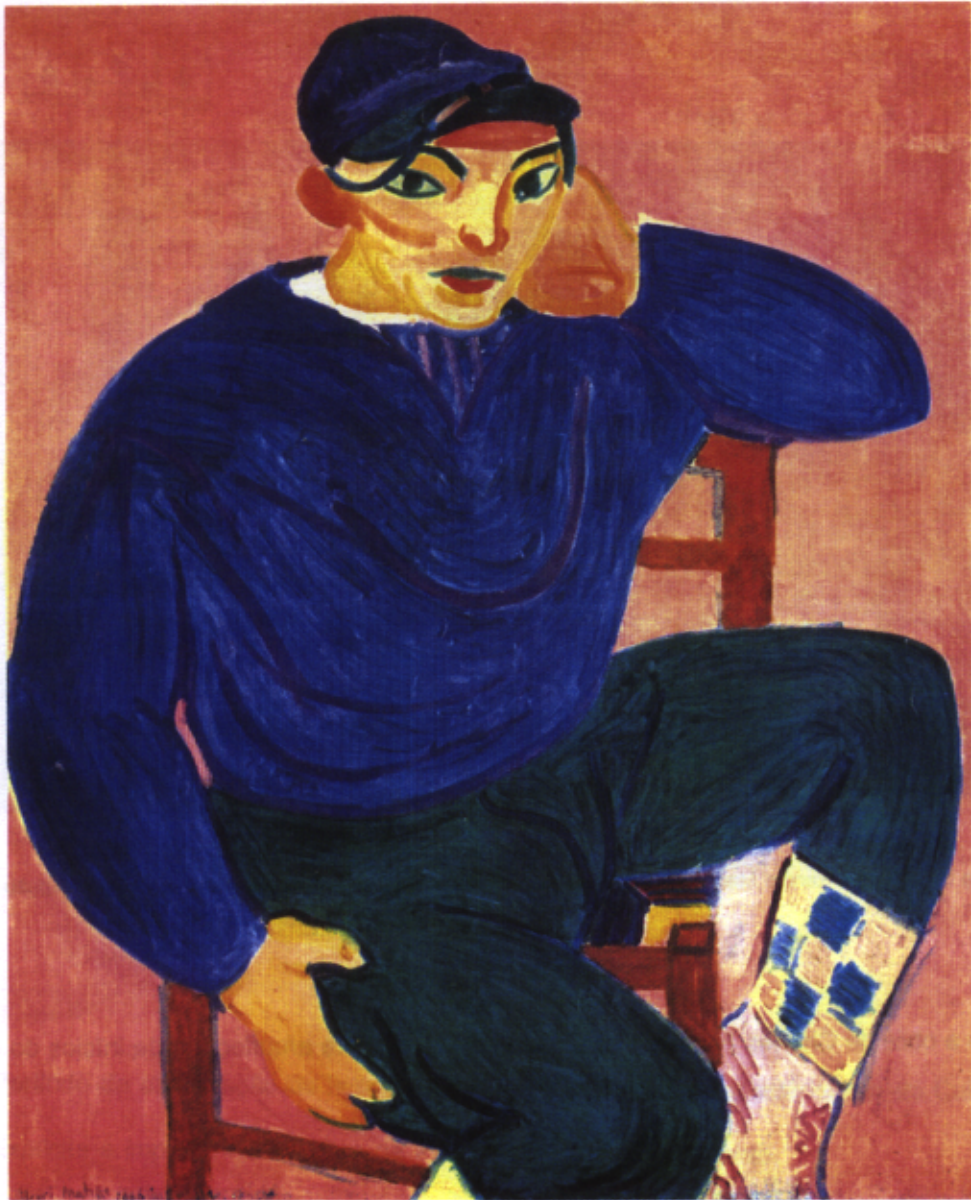
Figura 2 – Henri Matisse, Le Jeune Marin (1906)