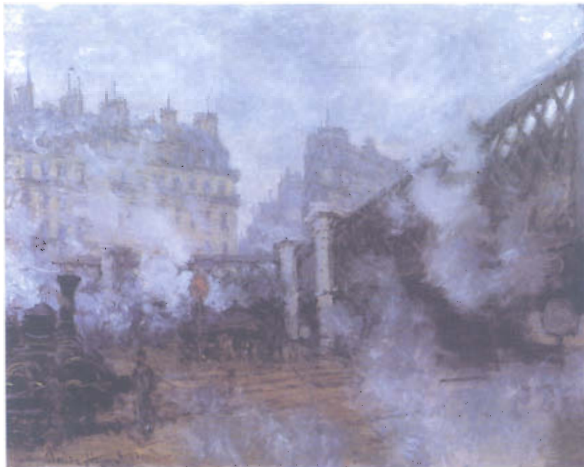
Figura 2 – Claude Monet, A Gare de Saint-Lazare (1877)