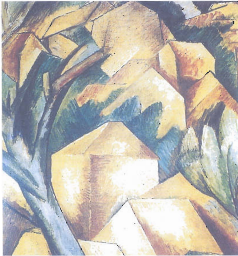
Figura 3 – Georges Braque, Casas em Estaque (1908)