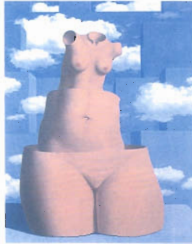
Figura 4 – René Magritte, Mania das Grandezas (1948/49)

Escolha apenas um dos itens deste Grupo. (Se responder aos dois, somente será considerada a sua primeira resposta.)