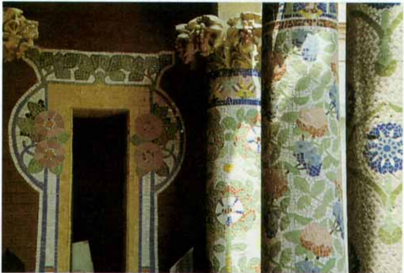
Figura 2 – Luis Doménech y Montaner, Palácio da Música Catalã, Barcelona, 1905-08

No fim do século XIX surgiram, por toda a Europa, movimentos artísticos inovadores que procuravam encontrar uma nova expressão estética para uma nova sociedade. De Glasgow a Paris, passando por Viena, Munique, Bruxelas e Barcelona, divulgaram-se programas artísticos que estiveram na base da Arquitectura e do Design modernos.