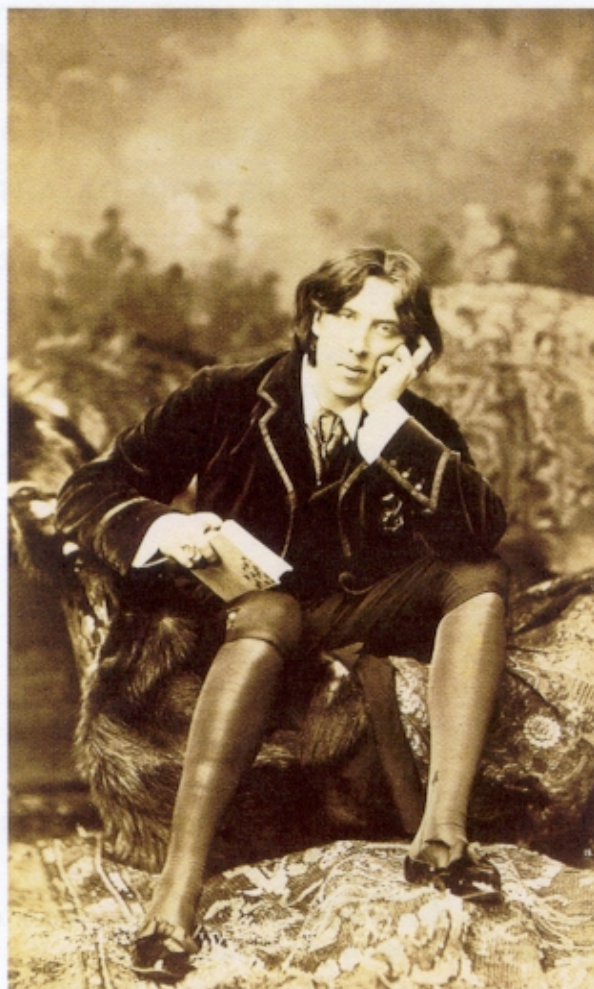
Figura 1 – N. Sarony, Retrato de Oscar Wilde , fotografia, 1882