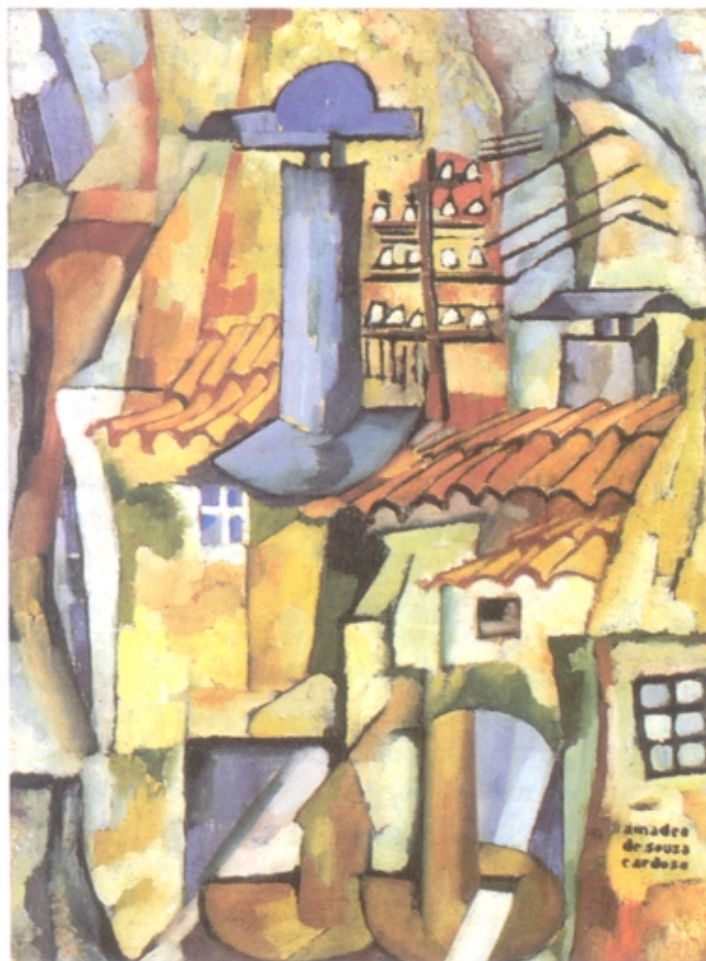
Amadeo de Souza-Cardoso

A partir da leitura da imagem, analise as tendências das artes plásticas do primeiro modernismo português, no quadro das vanguardas europeias do mesmo período.