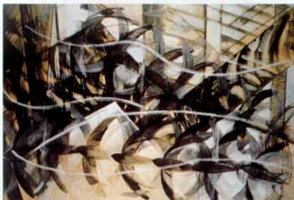
Giacomo Balla Nova Iorque – Museu de Arte Moderna

Ultimatum Futurista às Gerações Portuguesas do século XX (1917)