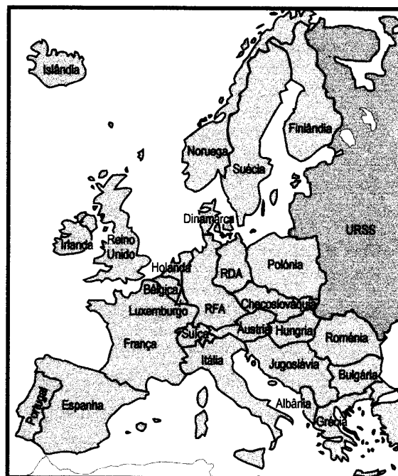
Figura 1 – Mapa político da Europa