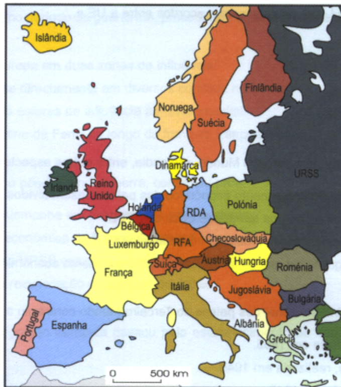
Figura 1 – Mapa político da Europa