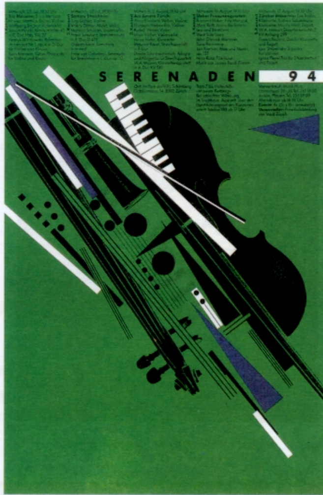
Figura 1 – Rosemarie Tissi, imagem gráfica de CD