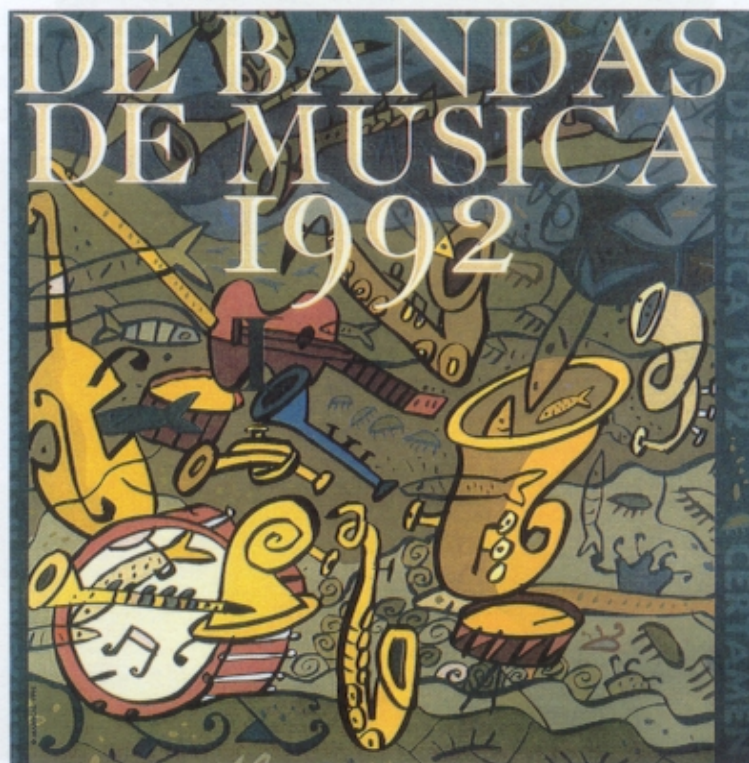
Figura 4 – Javier Mariscal, adaptação de uma imagem