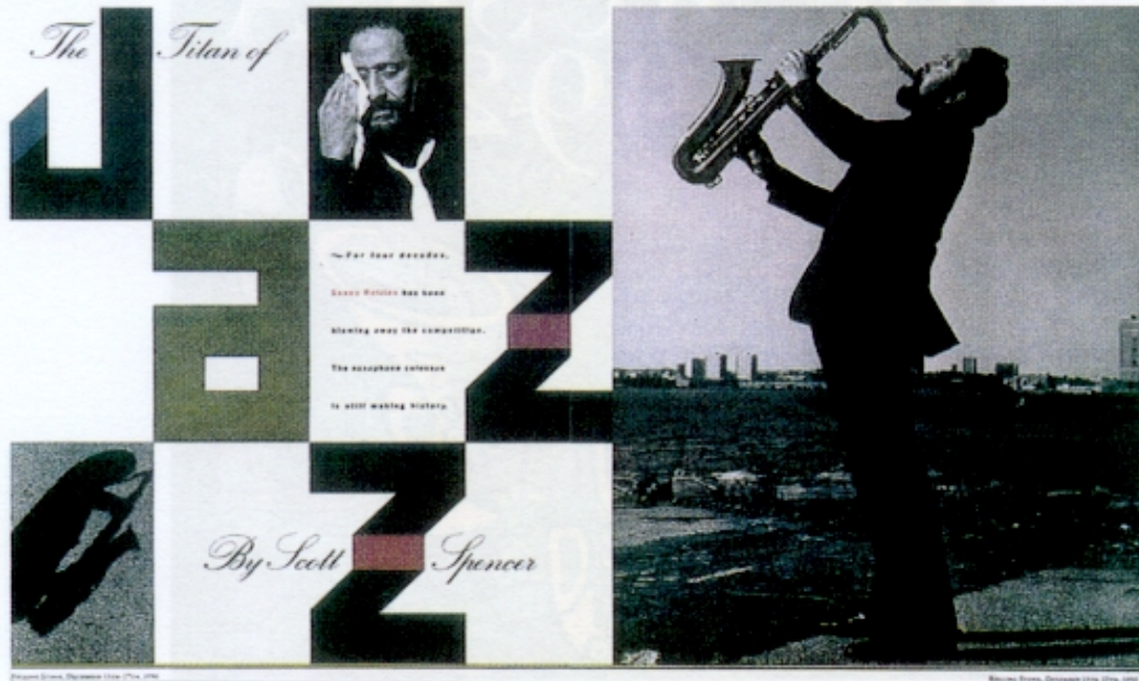
Figura 2 – Fred Woodward, imagem gráfica de CD