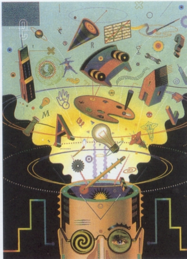
Figura 3 – Steven Lyons, ilustração gráfica