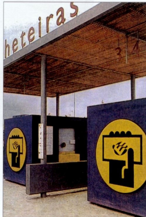
Figura 1 – Pictogramas criados para a Expo'98