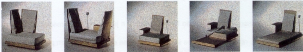
Figura 2 – Stéphanie Blasch e Nicolai Fuhrmann, Sofá, 1998