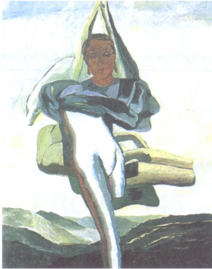
Figura 1 – Graça Morais, Suspensa entre a Terra e a Lua