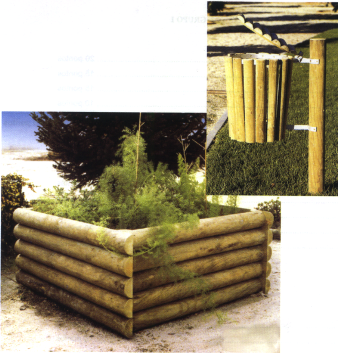
Figura 3 – Peças de mobiliário urbano