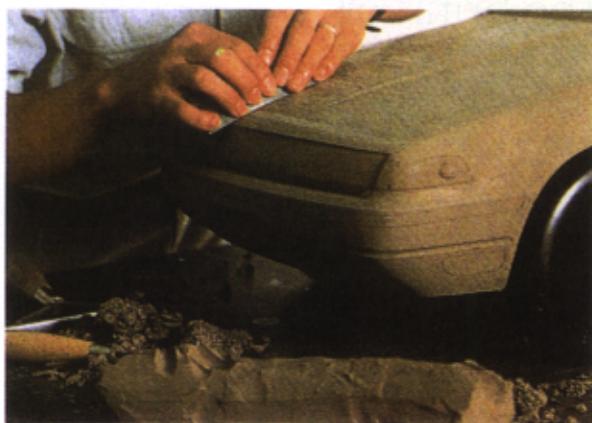
Figura 2 – Design do exterior de um automóvel (maqueta em barro modelado)