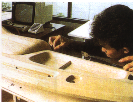
Figura 3 – Painel de comandos (estudo de pormenor – madeira)