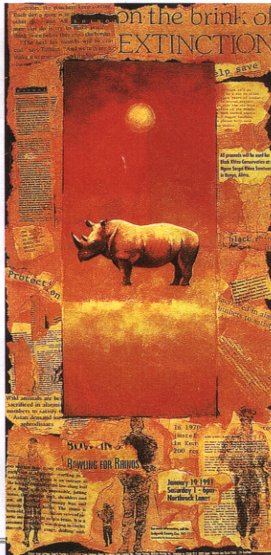
Figura 1 – Sonia Greteman, Luta pelos Rinocerontes , 1991