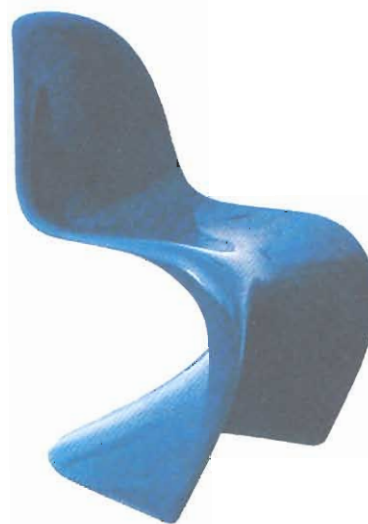
Figura 4 – Cadeira Panton , em plástico moldado, de Verner Panton, 1960