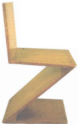
Figura 3 – Cadeira Zig-Zag , em madeira, desenhada por Gerrit Rietveld, 1932-34