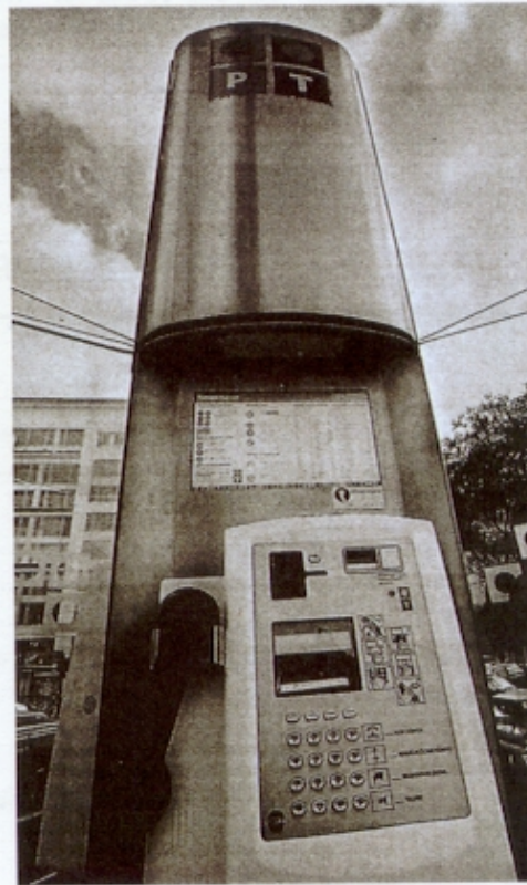
Figura 5 – Pedro Silva Dias, Cabina Telefónica