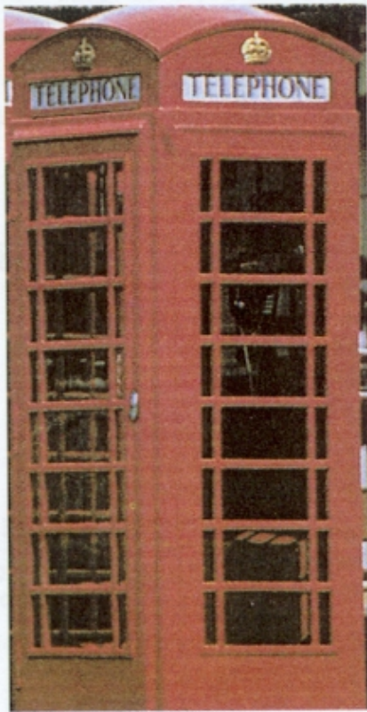
Figura 4 – Cabina Telefónica Tradicional Inglesa