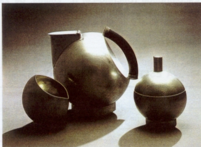
Figura 2 – Harry Bertoia, Serviço de Chá, 1940