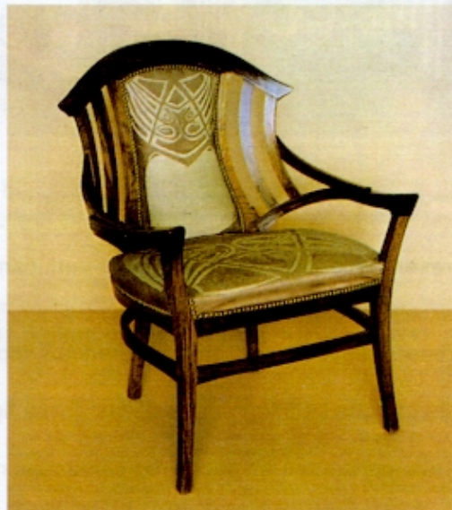
Figura 1 – Van de Velde, Cadeira, 1898