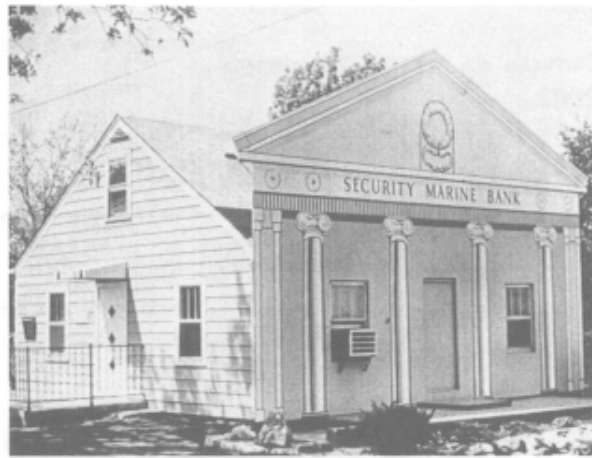
Figura 2 – Fachada de Robert Venturi, 1971

À frase «Less is more» («Menos é mais»), atribuída a Mies Van der Rohe e que expressa a filosofia do movimento funcionalista, Robert Venturi contrapôs, uns anos mais tarde, a frase: «Less is bore» («Menos é aborrecido»).