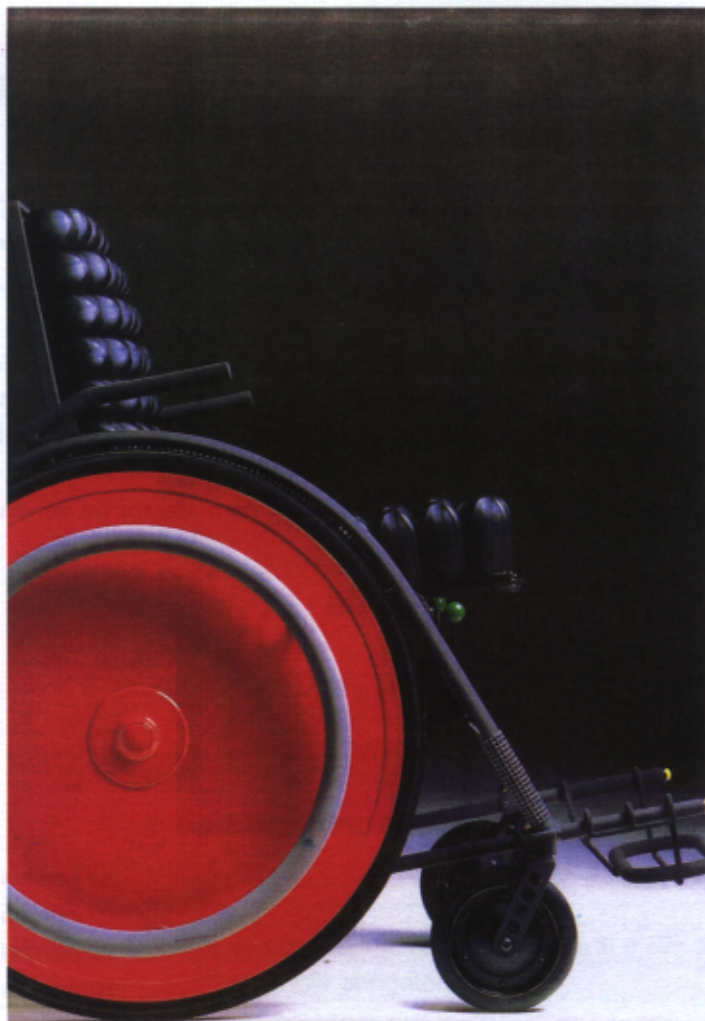
Figura 2 – Cadeira de Rodas

A cadeira de rodas representada na figura 2 apresenta aspectos que a diferenciam bastante das cadeiras de rodas mais vulgares.