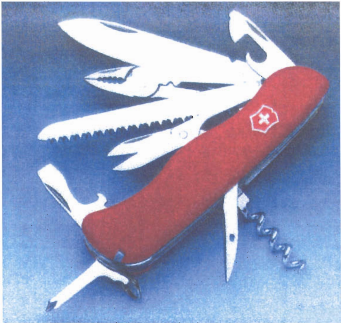
Figura 3 – Canivete suíço da marca Victorinox