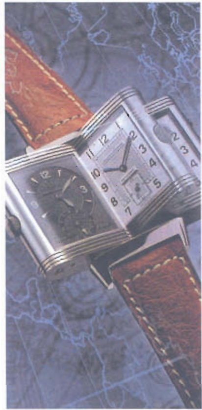
Figura 5 – Reverso, relógio da firma Jaeger-LeCoultre, anos 90