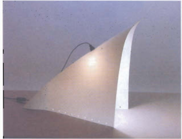
Figuras 1 e 2 – Candeeiros da colecção Ultra-luz