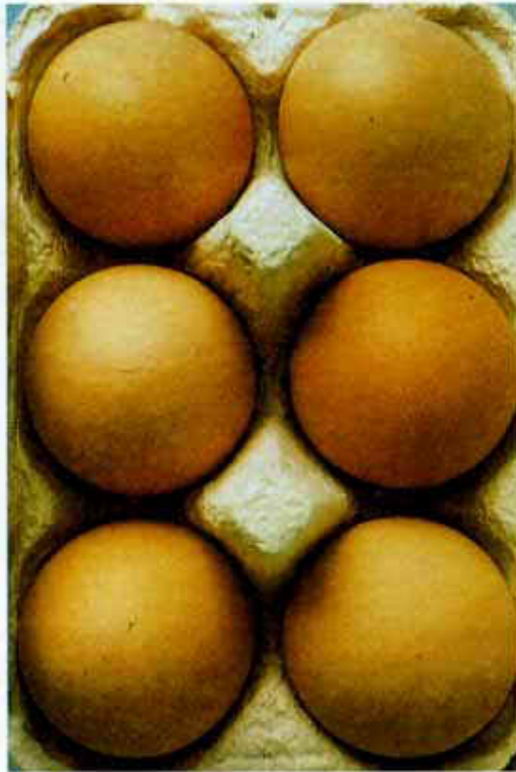
Figura 1 – Embalagem de ovos, de cartão reciclado