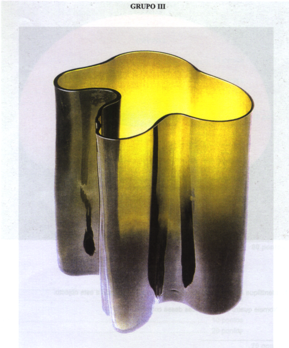
Figura 2 – Alvar Aalto, Vaso Savoy, modelo 3031, 1936