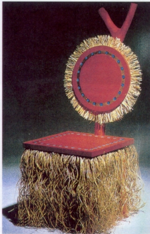
Figura 5 – Garouste e Bonetti, cadeira Prince Imperial , 1984

«(...) sempre que as características exteriores criarem algo de estranho, isso significa que não estão integradas no objecto e não surgiram simultaneamente com ele; se, porém, as qualidades formais forem verdadeiras, corresponderão à organização interna do objecto, estarão intimamente ligadas a ele e desenvolver-se-ão em consonância.»