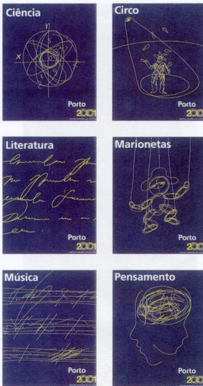
Figura 3 – Aplicações do símbolo/logótipo da figura 2