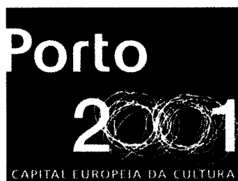
Figura 2 – Símbolo/logótipo do evento Porto 2001, Capital Europeia da Cultura