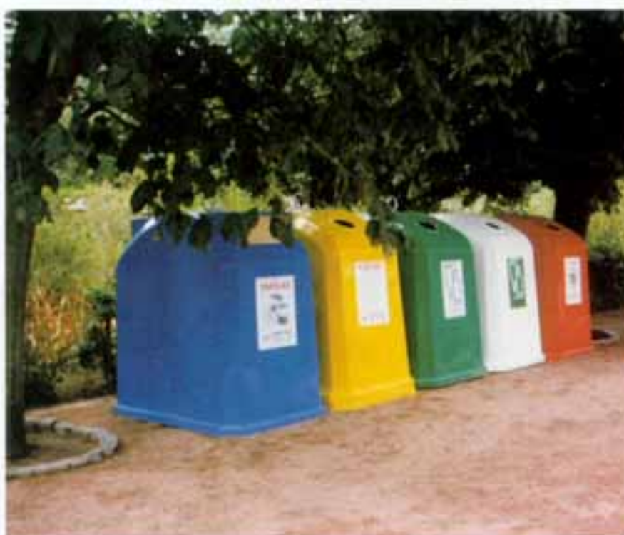
Figura 2 – Contentores para recolha de papel, plástico, vidro e latas; exposição «Design para a Cidade», Fundação de Serralves, Porto, 1991

Diga em que consiste a avaliação de custos.