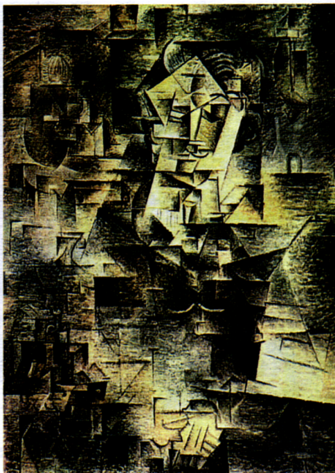
Figura 4 – P. Picasso, Retrato de D. H. Kahnweiler , 1910