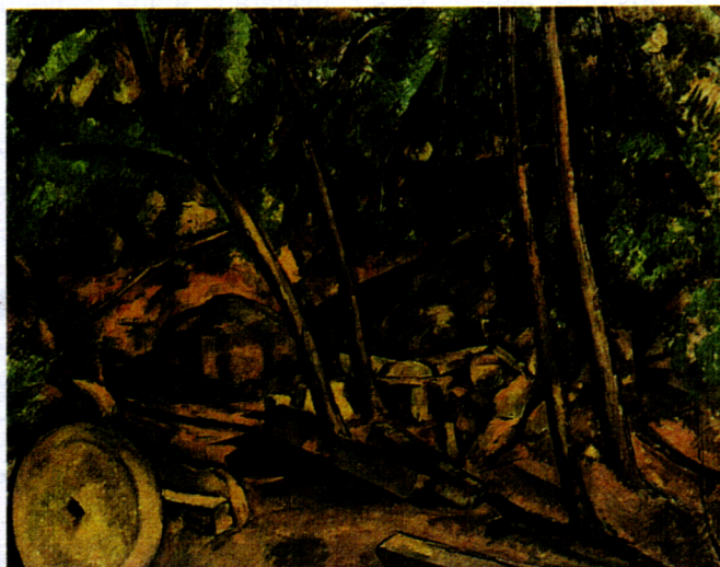
Figura 3 – P. Cézanne, A Mó , óleo sobre tela, 1898-1900

«A pintura é uma óptica, e a essência da nossa arte reside sobretudo naquilo que os nossos olhos pensam. [...] Tudo na Natureza se modela como esferas, cones e cilindros...»