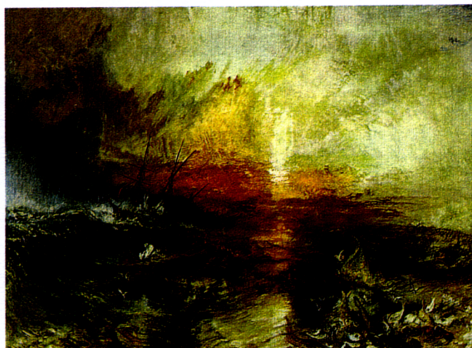
Figura 2 – J. M. W. Turner, O Navio Negroiro , 1839