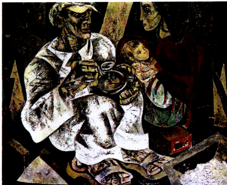
Figura 6 – Júlio Pomar, O Almoço do Trolha , 1946-50