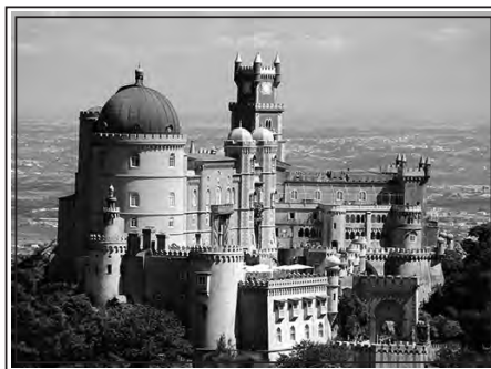
Palácio da Pena

Estávamos mesmo a chegar ao Castelo dos Mouros e o tio propôs que parássemos para lanchar e ver a paisagem.