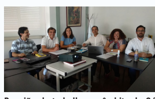
Reunião de trabalho no âmbito da 2.ª Missão de Cabo Verde no IAVE