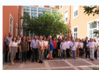
Participantes na reunião de apresentação do PAR

A apresentação do projeto realizou-se no dia 12 de setembro, nas instalações do IAVE, onde estiveram presentes, além dos diretores das escolas envolvidas, representantes da Secretaria de Estado da Educação, das Direções Regionais da Educação dos Açores e da Madeira, da Direção-Geral da Educação, da Direção-Geral dos Estabelecimentos Escolares e do Júri Nacional de Exames.