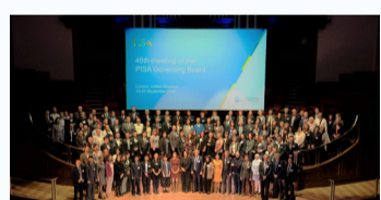
Participantes na 48.ª reunião de PGB do PISA, em Londres