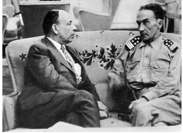
B – Humberto Delgado e Henrique Galvão a bordo do paquete Santa Maria .