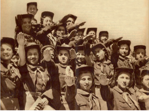
A – Fundação da Mocidade Portuguesa Feminina.