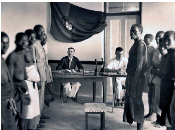
C – Tribunal indígena em Moçambique, no ano da promulgação do Ato Colonial.