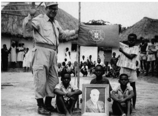
A – Soldado português em África, durante a Guerra Colonial.