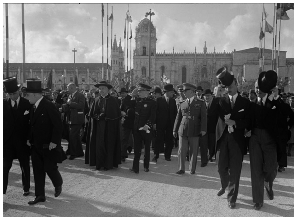
B – Inauguração da Exposição do Mundo Português.