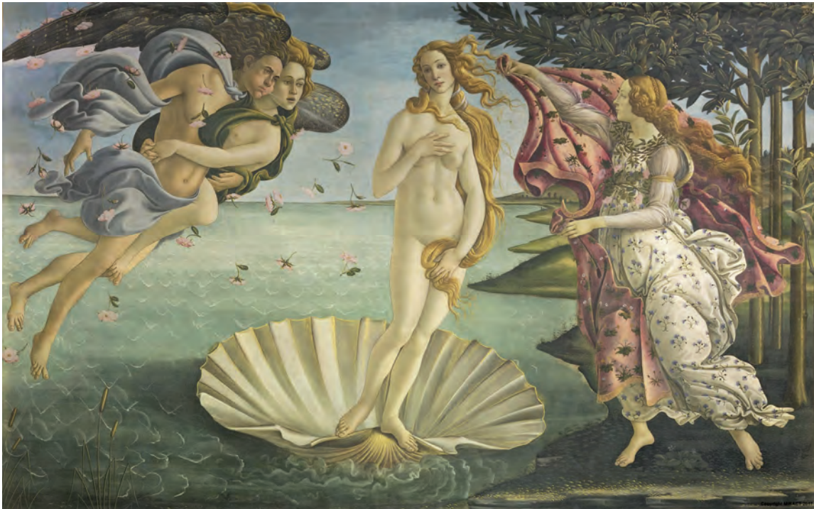
Figura 1 – Sandro Botticelli, O Nascimento de Vénus , c. 1485, têmpera sobre tela, 172,5 x 278,5 cm

in www.uffizi.it (consultado em outubro de 2021).