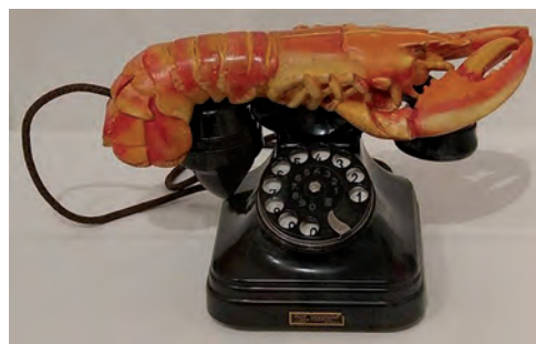
Figura 6 – Salvador Dalí, Telefone Lagosta , 1938, telefone comum e lagosta em gesso pintado, 17,8 x 33 x 17,8 cm