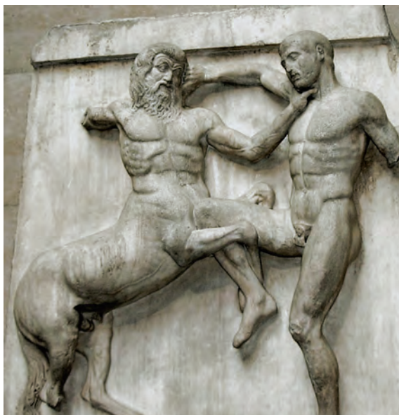
Figura 1 – Luta entre Centauro e Lápita, métopa do Pártenon , século V a. C.