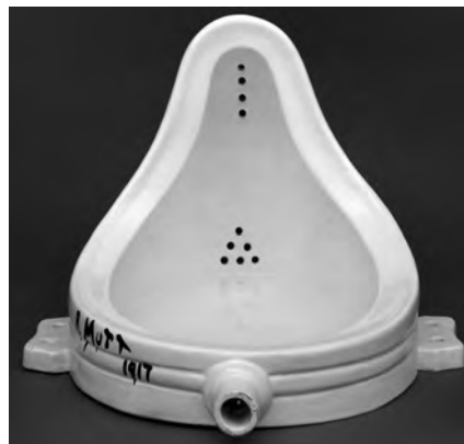
Figura 5 – Marcel Duchamp, A Fonte , 1917 (réplica de 1964), porcelana, 36 x 48 x 61 cm