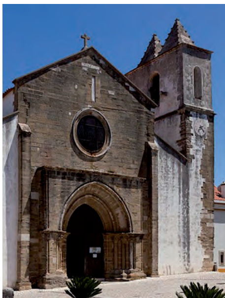
Figura 2 – Igreja de S. Leonardo, Atouguia da Baleia, séculos XIII-XIV