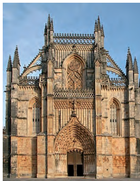
Figura 3 – Igreja de Santa Maria da Vitória, Batalha, séculos XIV-XV

* 2.1. O período de «consolidação da estética gótica» (Texto B) está fundamentalmente associado