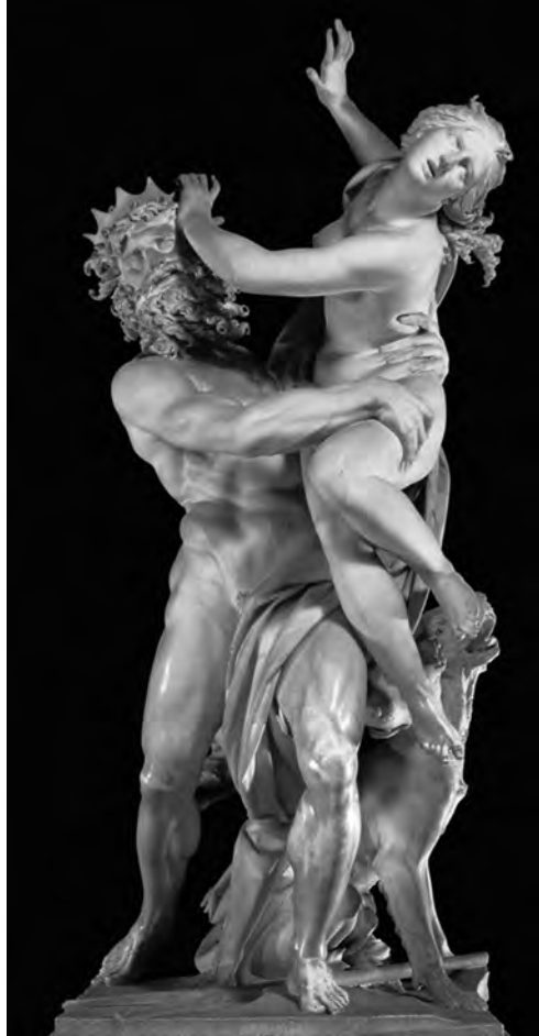
Figura 2 – Gian Lorenzo Bernini, O Rapto de Proserpina , 1621-1622, mármore, 255 cm

in https://galleriaborghese.beniculturali.it (consultado em outubro de 2021).