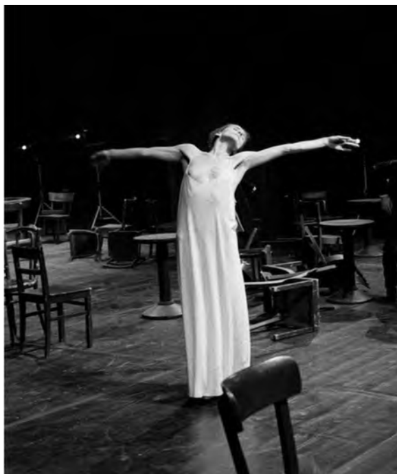
Figura 8 – Pina Bausch, Café Müller , 1982, fotografia de Silvia Lelli

in www.artsy.net (consultado em novembro de 2021).