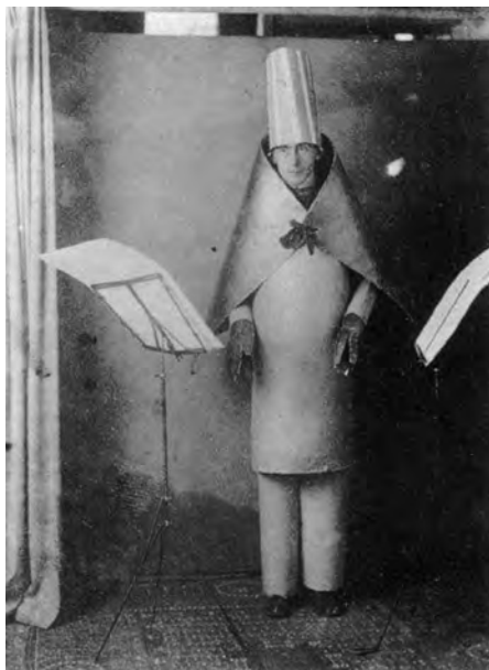
Figura 4 – Hugo Ball, atuação no Cabaret Voltaire , Zurique, 1916

* 4. Observe as Figuras 4, 5 e 6 e leia o Texto A.