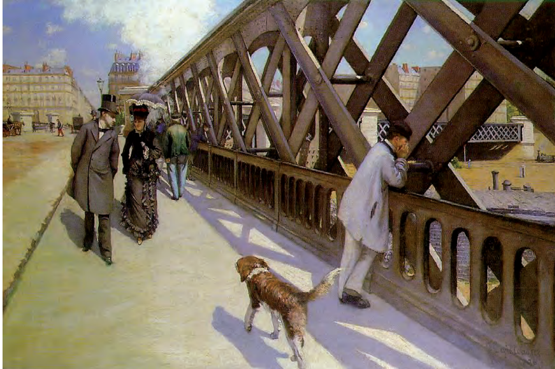
Figura 1 – Gustave Caillebotte, A Ponte Europa , 1876, óleo sobre tela, 125 x 181 cm