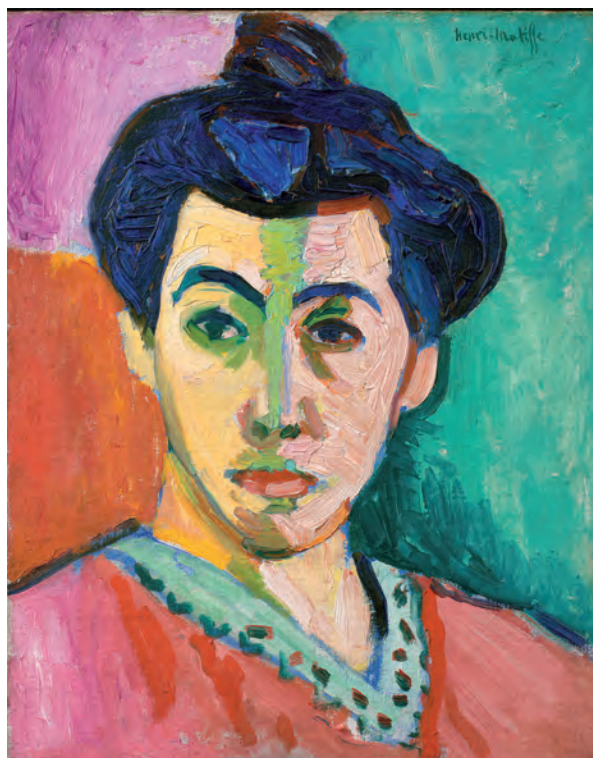
Figura 3 – Henri Matisse, Retrato de Madame Matisse , 1905, óleo sobre tela, 40 x 32 cm

Compare as pinturas reproduzidas nas Figuras 2 e 3.