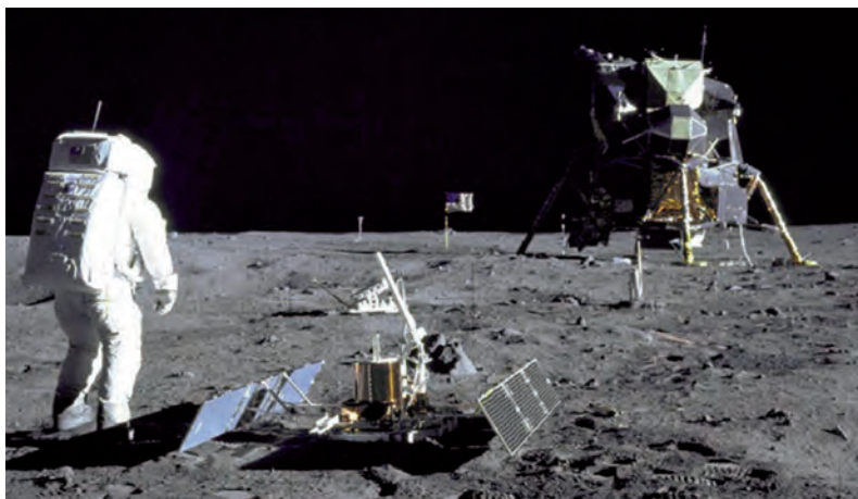
Figura 7 – Edwin Aldrin na superfície lunar durante a missão Apollo 11, 20 de julho de 1969, fotografia de Neil Armstrong/NASA

in https://america.cgtn.com (consultado em novembro de 2021).