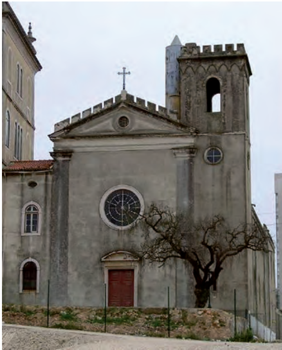
Igreja paroquial de Campolide, Lisboa, 1879-1884