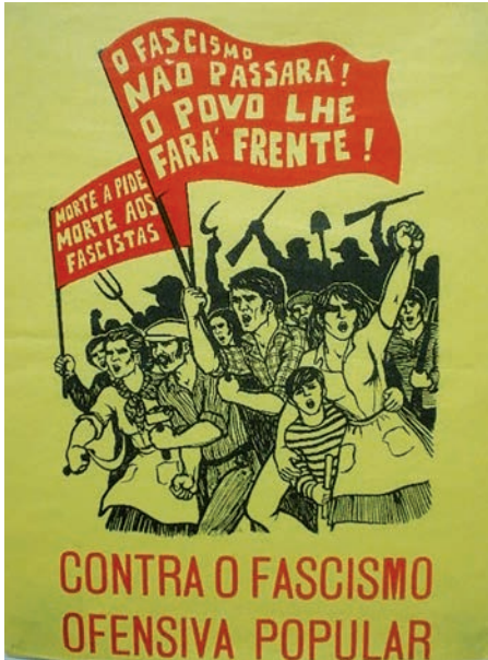
A – Cartaz produzido no contexto do Processo Revolucionário em Curso.