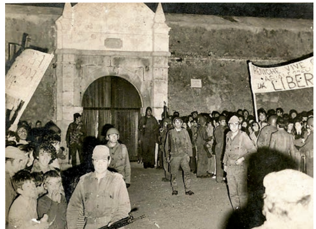
D – Libertação dos presos políticos da Cadeia do Forte de Peniche.