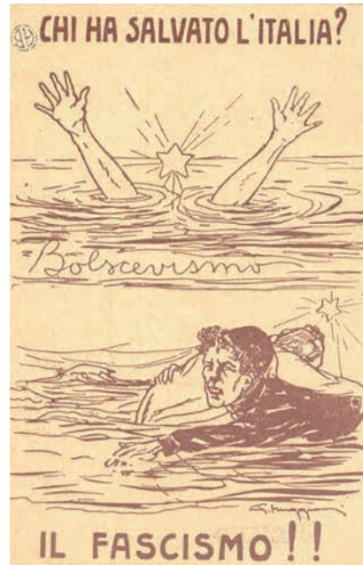
B – Marcha sobre Roma: «Quem salvou a Itália [do Bolchevismo]? – O Fascismo!»