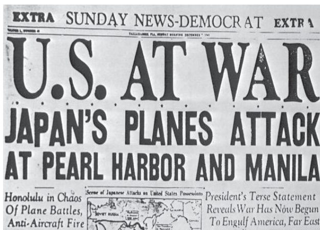
C – «Os Estados Unidos em guerra. Aviões japoneses atacam Pearl Harbor e Manila.»