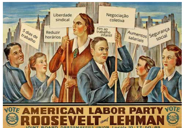
D – Cartaz de apoio do Partido Trabalhista Americano à reeleição de Roosevelt para a presidência dos EUA, no contexto da segunda fase do New Deal .