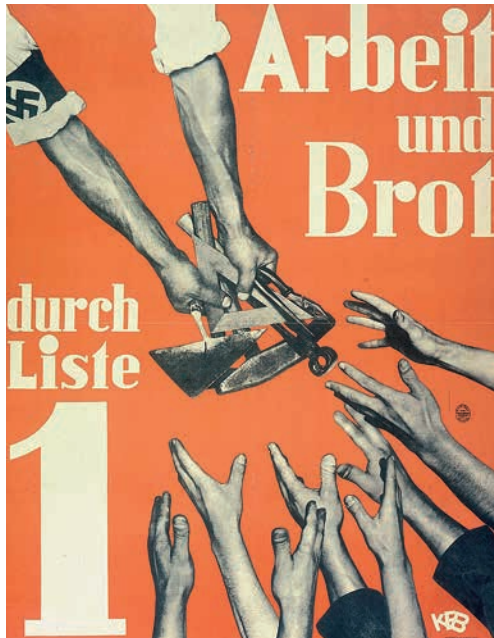
A – «Trabalho e pão. Vota na lista 1»: cartaz da campanha que antecedeu a nomeação de Adolf Hitler para chanceler da Alemanha.