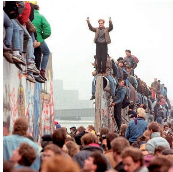
D. Concentração popular no contexto da queda do Muro de Berlim.