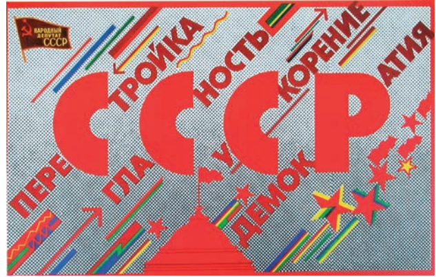
B. «URSS: Perestroika, Glasnost, Aceleração, Democracia» – o início da Era Gorbatchov.