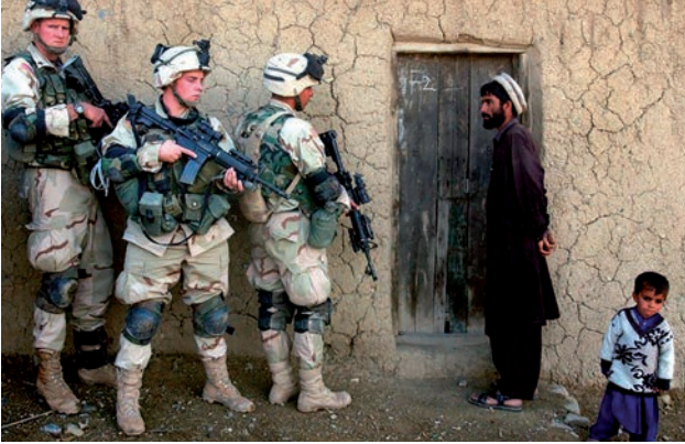
A. Invasão do Afeganistão, liderada pelos EUA, após o 11 de Setembro.