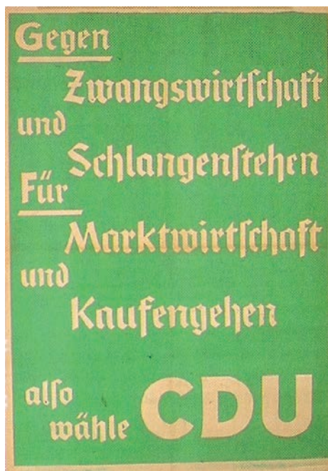
C. Cartaz da União Democrata-Cristã nas eleições estaduais, na Alemanha Ocidental, durante a ocupação aliada: «Contra a economia dirigida e as filas de racionamento. A favor da economia de mercado e da liberdade de comprar. Por isso, vote CDU».