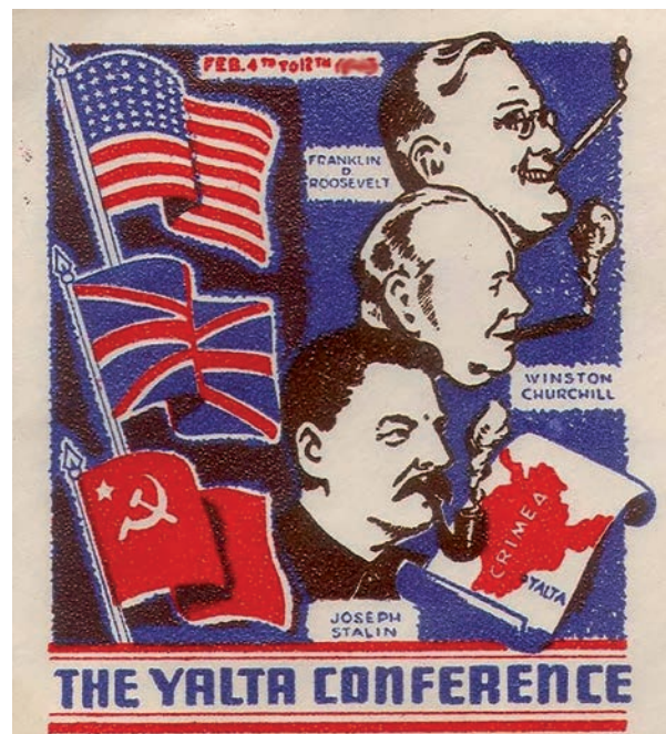
D. Cartão-postal com a representação dos três líderes aliados presentes na Conferência de Ialta.