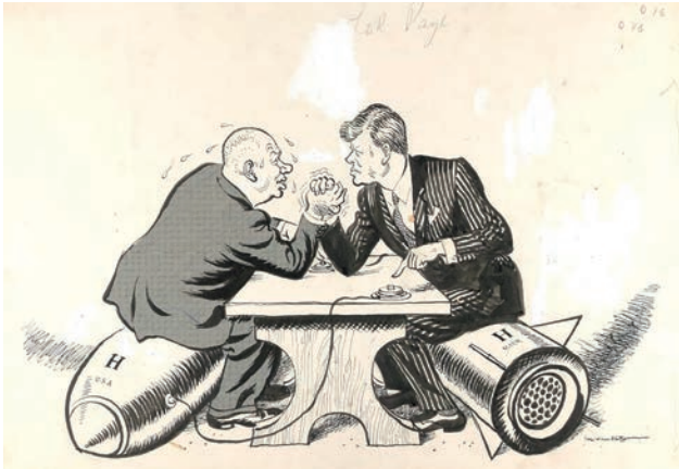
A. N. Khrushchov e J. Kennedy, numa caricatura de Illingworth alusiva à crise dos mísseis de Cuba.